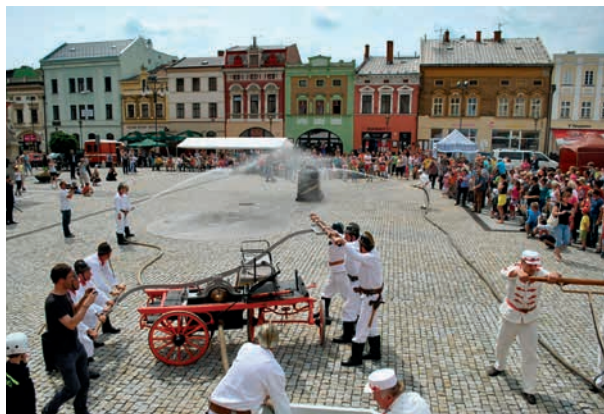
Na Masarykově náměstí bude předvedena historická i moderní hasičská technika.

Areál letního kina, který své brány otevře ve 14:00 hodin, se