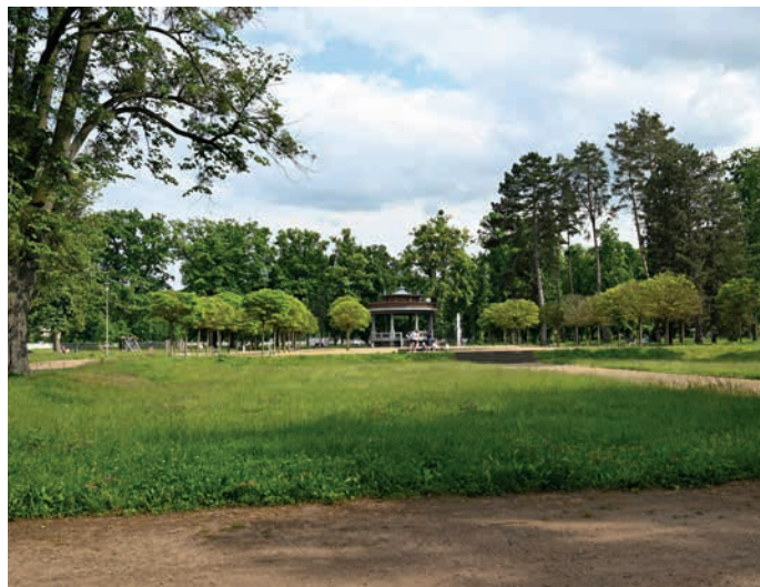
Sady Čs. legií jsou oblíbeným cílem procházek.

Park bude doplněn o keřové patro, které do parku díky svým květům vnese větší atraktivitu ve vegetačním období a podpoří biodiverzitu. Ve vybraných místech je navržena i výsadba vyšších keřů, a to především k odclonění tenisových kurtů a workoutového hřiště, takže