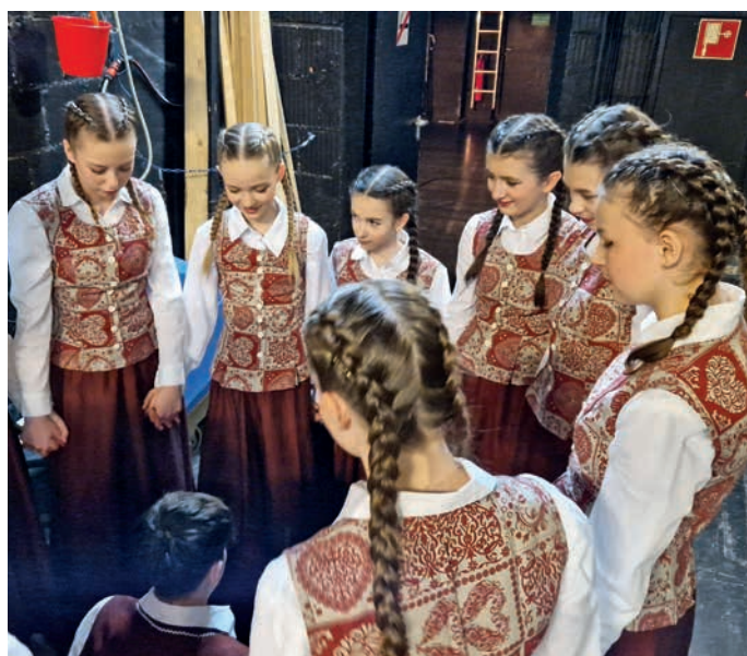
Soustředění před vystoupením.

V tuto chvíli se snažíme zajistit zázemí pro soutěžící a zejména finanční podporu, neboť náklady na dopravu a ubytování, stejně tak i startovné, jsou velmi vysoké.