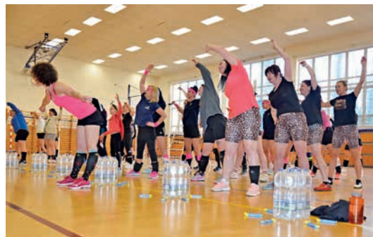
Retro rozcvičku braly všechny volejbalistky velmi zodpovědně.

část vítězných hráček patří. Na 2. místě se umístila nejmladší děvčata z týmu Mickeyho klubík. Všem zúčastněným ženám gratulujeme a děkujeme, že dorazily a společně s námi vytvořily příjemnou a podporující atmosféru turnaje. Martina Macháňová