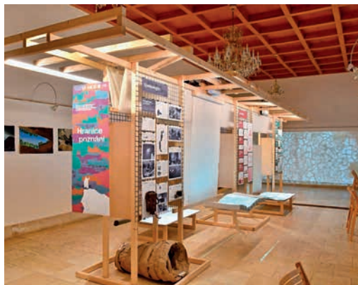
Výstava je k dispozici návštěvníkům do 11. srpna ve Velkém sále Staré radnice v Hranicích.

Cílem výstavy je přiblížit široké veřejnosti výsledky tohoto výzkumu s důrazem na srozumitelnost a názornost prezen-