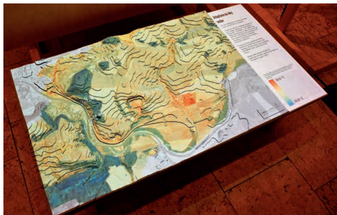
Animovaná projekce vývoje krajiny.