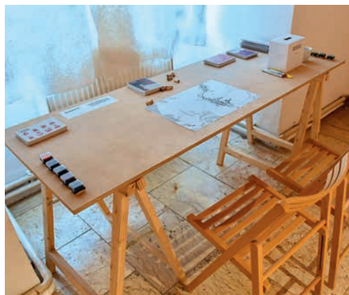
Součástí výstavy je také badatelský koutek.

i animované projekce geologického vývoje a vývoje krajiny, fyzický model Hranické propasti, badatelský koutek a výstava prací žáků základních a uměleckých škol v Hranicích, Černotíně a Ústí.