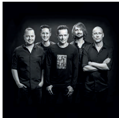
Hlavním tahákem slavností se stane vystoupení hudební kapely Chinaski.

kteřá rozproudí krev všem návštěvníkům. Vstup do areálu letního kina bude zploplněn částkou 300 Kč, nabídne ale návštěvníkům neocenitelný zážitek a nezapomenutelné chvíle plné