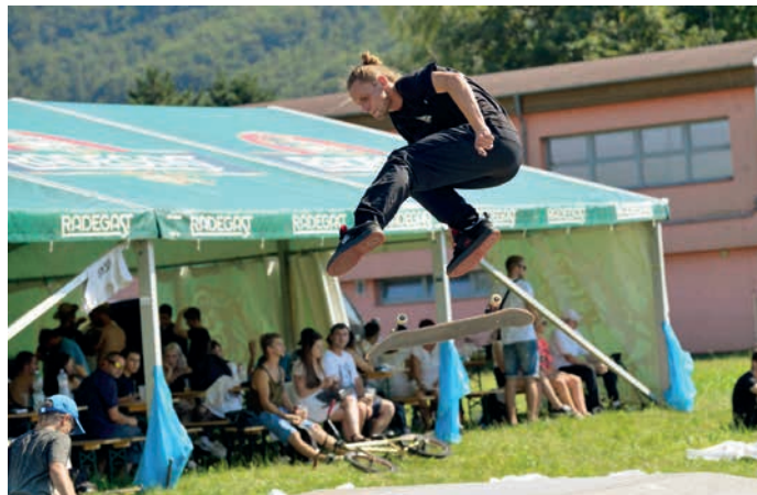
Slavnostní otevření nového skateparku ožíví skateboardisté svými triky.

Celkově lze očekávat, že Grand Opening skateparku v Hranicích bude znamenat zásadní krok vpřed v podpoře skateboardingu a jeho kultury