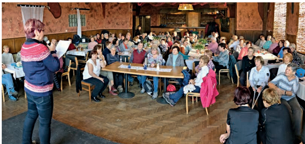
Hraniční senioři se na závěr roku tradičně sešli u v hostinci U Jarky v Klokoči, jinak se prý už nevejdou.

Klub využívá prostory v budově Na Náspech 57, část sportovních aktivit se uskutečňuje v hranických sportovních zařízeních. Pravidelná týdenní nabídka zahrnuje různé druhy cvičení, stolní tenis, spinning, BOSU, zumbu, plavání, country tance, zpívání pro radost, kurzy angličtiny a němčiny. Klub nabízí zájezdy do divadel, přednášky a besedy s různým zaměřením, výtvarné a rukodělné činnosti. Podstatná část činnosti klubu je zaměřena na sport a aktivní pobyt v přírodě – časté jsou turistické vycházky, výlety, cykloturistika, zkusíme pétanque