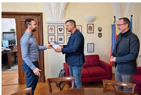
Vedení města přebírá ocenění za 2. místo v Olomouckém kraji v hodnocení Indexu kvality života.

V tomto výzkumu, který porovnává celkem 206 obcí s rozšířenou působností včetně Prahy na základě veřejně dostupných dat, se opět ukázala atraktivnost velkých aglomerací. Nejvyšší kvalita života je tradičně pře-