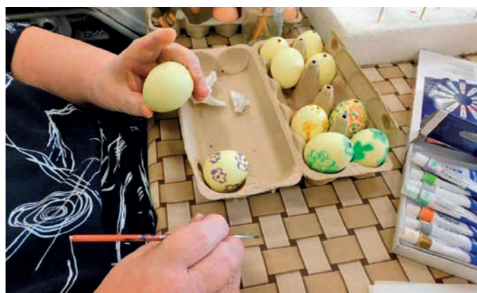
Obyvatelé Domova seniorů si společně užili malování velikonočních kraslic.

Poskytované služby vychází z individuálních potřeb klientů. V přiměřené míře s ohledem na zdravotní stav jsou uživatelské podporování v rozhodování a soběstačnosti. Hlavním cílem je zajištění důstojného a plnohodnotného prožití života s důrazem na zachování schopností a doved-