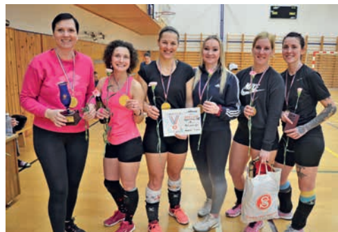
Vítězný tým „Malá Lucka“.

TIRÁŽ: Hranický zpravodaj č. 4/2024 - Periodický tisk územního samosprávného celku. - Vychází 12x ročně v Hranicích - Vychází 1. dubna 2024 - Ročník X. - Vydávající Městská kulturní zařízení Hranice, příspěvková organizace se sídlem Masarykovo náměstí 71, 753 01 Hranice, IČO: 71294686 - Grafická úprava a tisk: © KLEINWÄCHTER holding s.r.o., Čajkovského 1511, 738 01 Frýdek-Místek - Náklad: 8 400 ks - Distribuce: Česká pošta, zdarma do všech domácností v Hranicích a místních částí - Redakce: tel. 581 607 479, e-mail: infocentrum.zamek@mkz-hranice.cz - Editoři: Mgr. Petr Černochoch, Ing. Petr Bakovský - Korektury: Mgr. Renata Doleželová - Hranický zpravodaj na internetu: www.mesto-hranice.cz/hranicky-zpravodaj - Zaregistrováno Ministerstvem kultury ČR pod zn. MK ČR E 22143 - Redakce si vyhrazuje právo příspěvky krátit - Účastí na programech pořádaných Městskými kulturními zařízeními Hranice, p. o., IČO 71294686, dává jejich účastník souhlas s užitím pořízených fotografií a videodokumentace pro propagační materiály organizace (webové stránky, Hranický zpravodaj, tiskoviny, Facebook). Souhlas se dává do odvolání.