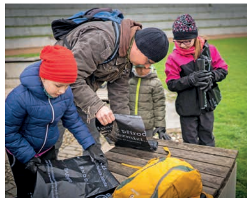
I ti nejmenší chtějí mít své město čistší a hezčí.

V loňském roce se akce účastnilo na padesát dobrovolníků,