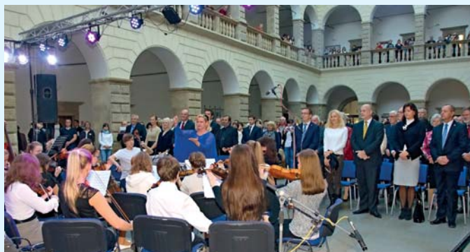
Dne kultury na zámku v sobotu 24. října se zúčastnili také představitelé partnerských měst Hranic ze Slovenska, Slovinska, Polska a Holandska.