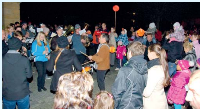
Stovky lidí vyrazily ve středu 28. října do lampionového průvodu městem, aby si připomněly 97. výročí vzniku samostatného československého státu.