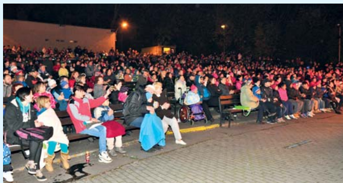
Lampionový průvod pak od Staré radnice, kde proběhlo kladení věnců k bustě T. G. Masaryka, pokračoval do letního kina. Návštěvníky čekala ohňová show a promítání filmu Konečně doma.