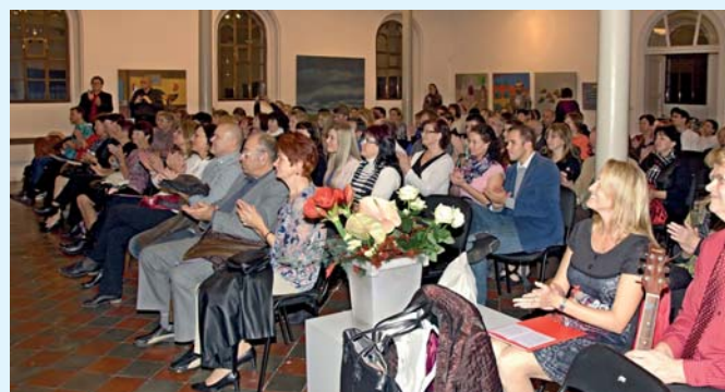
Synagoga patřila v sobotu 7. listopadu oslavám hranického Ženského komorního sboru. Ten funguje už čtvrt století. Text: Naďa Jandová