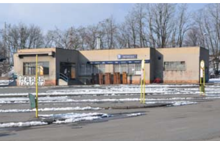
Hranické autobusové nádraží volá po rekonstrukci.

Rozpočet města Hranic na rok 2016 má novou podobu. Pro občany je přehlednější, protože návrh rozpočtu je strukturovaný po takzvaných střediscích, což jsou jednotlivé oblasti jako například komunikace ve městě, odpadové hospodářství, oblast sportu, oblast kultury nebo oblast sociálních záležitostí a další.