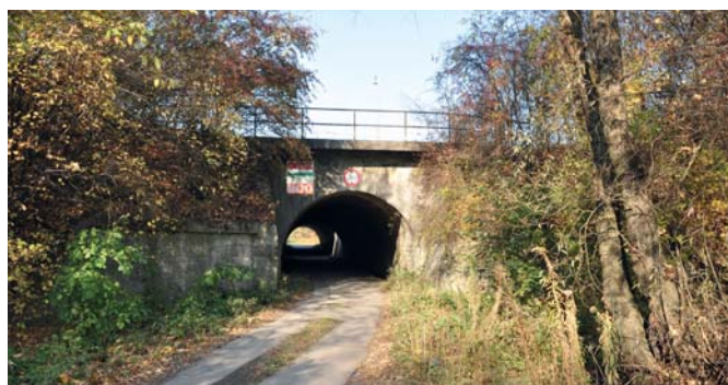
Případný severní obchvat města musí vyřešit dva podjezdy pod železniční tratí, tento je u průmyslové zóny Sigma 2.