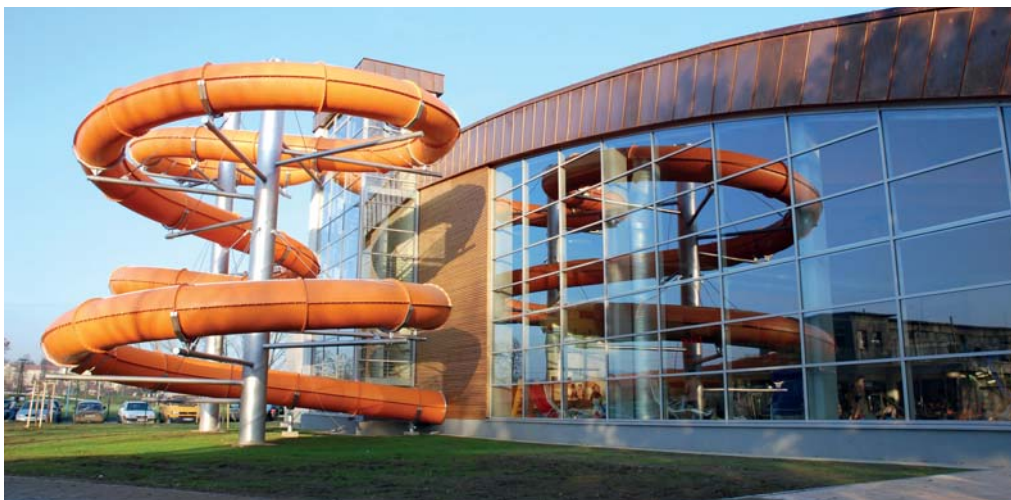
Mezi lákadla hranické Plovárny patří stometrový tobogán.

Kde v prosinci protáhnout tělo, když nebude sníh? Kde spálit přebytečné kalorie, nabrané v rámci předvánočního ochutnávání, vánočního „nápávání“ či silvestrovského slavení? Můžete zkusit Hranickou Plovárnu, která má otevřeno téměř celý prosinec a můžete si zde zaplavat i na Silvestra. Zavřeno bude pouze 24. a 25. prosince a pak také