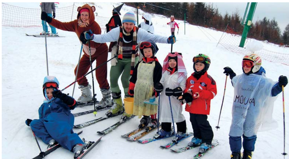
Lyžařskou školu na Potštátě zakončuje pravidelně oblíbený karneval na sněhu.

Ano, už je možné se hlásit. Je otevřena pro děti od 4 let a mohou se učit jak na lyžích, tak i na snowboardu. Lyžařská škola je šestidenní a je zakončena oblíbeným karnevałem. Podrobné informace lze nalézt na našem webu www.skipotstat.cz a také facebooku.