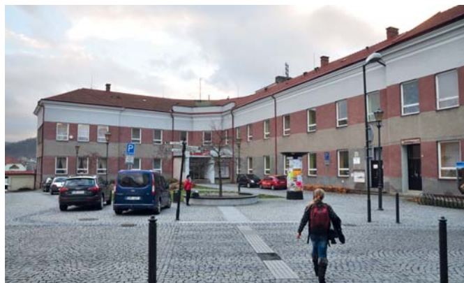
Budova ZUŠ Hranice bude mít nová okna i fasádu.

Provozní výdaje rozpočtu města zahrnují nejen finance vyčleněné na komunikace,