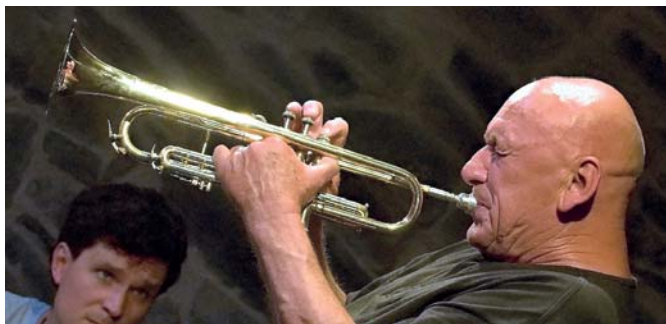
Fotografie z loňského ročníku Evropských jazzových dnů budou k vidění na výstavě na zámku.

V úterý 5. dubna rozezná Koncertní sál „Edith Piaf – Mon amour“. Tento koncert je věnovaný královně šansonu při příležitosti stého výročí jejího narození. Účinkuje mul-