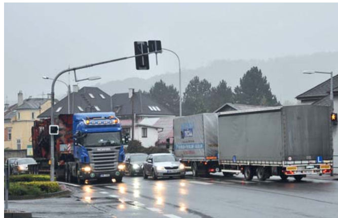
Palačovská spojka by mohla městu ulehčit o tranzitní dopravu, zejména o projíždějící kamiony.

Rozpočet stavby Palačovské spojky byl zatím předběžně stanovený na zhruba 3,1 miliardy korun.