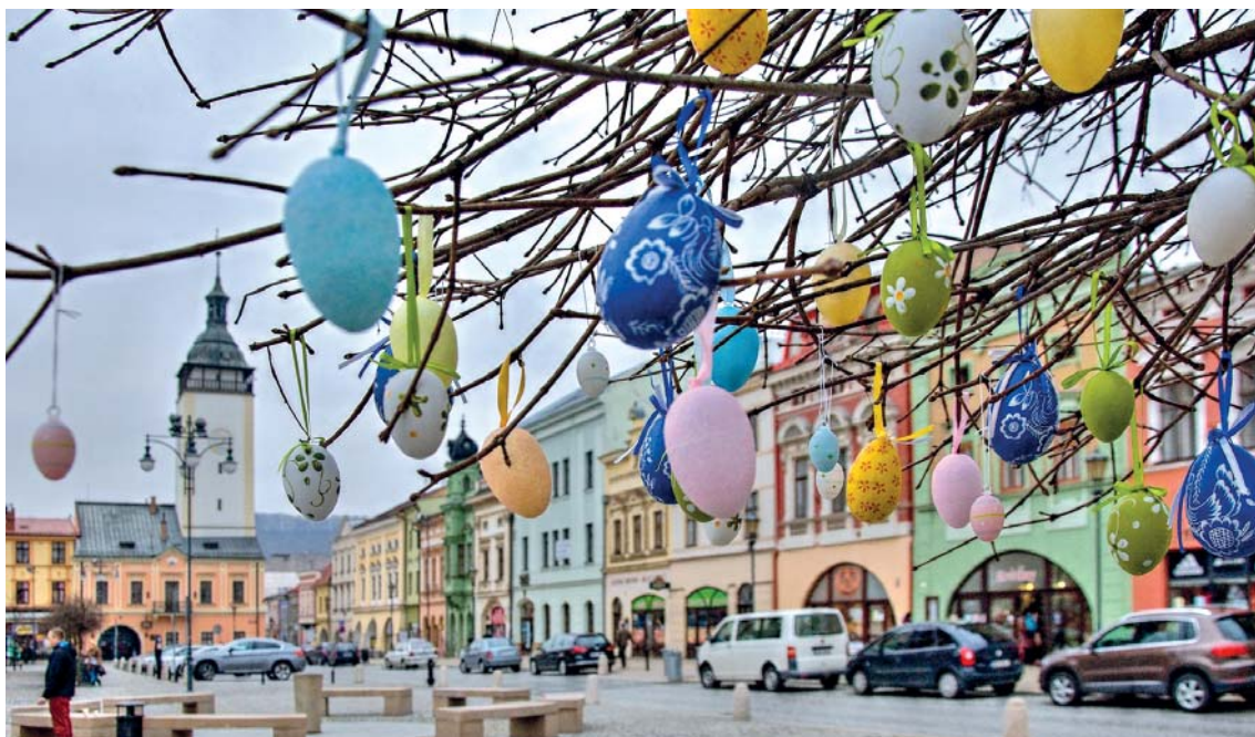
Takto nějak to bude vypadat na hranickém Masarykově náměstí pod Kraslicovníkem hranickým.

Vyfouknutá vajíčka zdobili na Kraslicovník hranický lidé pod vedením učitelů výtvarného oboru ZUŠ Hranice v sobotu 27. února ve dvoraně zámku. Potěšitelné je, že se do projektu zapojilo i centrum U kocoura Mikeše, které pořádá v úterý 1. března od 10 hodin Velikonoční tvoření pro maminky s dětmi s podtitulem „Přijďte nám pomoci vytvořit