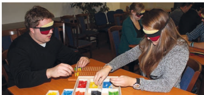
Ve světě nevidomých si zájemci mohou vyzkoušet, jaké je hrát různé hry potmě.

Jak se v kavárně běžně cítí nevidomý návštěvník, si mohou zájemci vyzkoušet na akci s názvem Kavárna ve tmě.