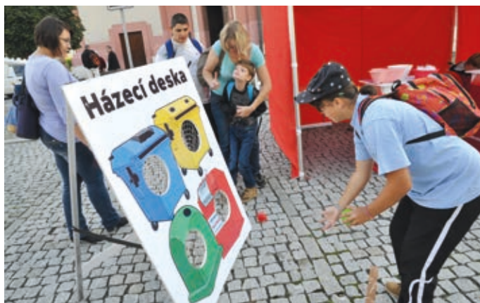
Cena za svoz komunálního odpadu se odvíjí také od toho, kolik odpadu se povede vytrít. Proto město podporuje akce typu „Barevný den“, kde se děti učí jak třídit odpad.

Poplatek ve výši 600 korun je možné zaplatit již nyní, buď na pokladně Městského úřadu Hranice, a to denně dle