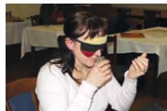
Kavárna ve tmě láká k návštěvě str. 4