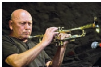
Přípravy Evropských jazzových dnů str. 6