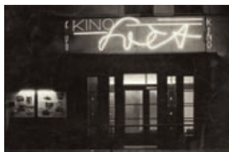
Muzeum chystá výstavu kinematografie str. 7