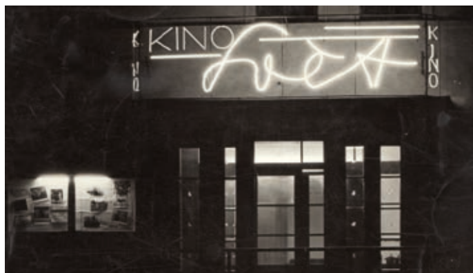
Jedno z kin, které bude na výstavě představeno, je kino Svět.

Hranický svět kinematografie bude přístupný od 2. března do 23. dubna. Slavnostní vernisáž se uskuteční ve čtvrtek 2. března v 17 hodin. (red)