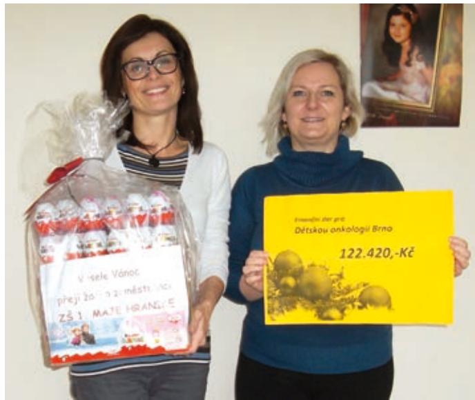
Do sbírky se zapojila i Základní škola 1. máje Hranice.