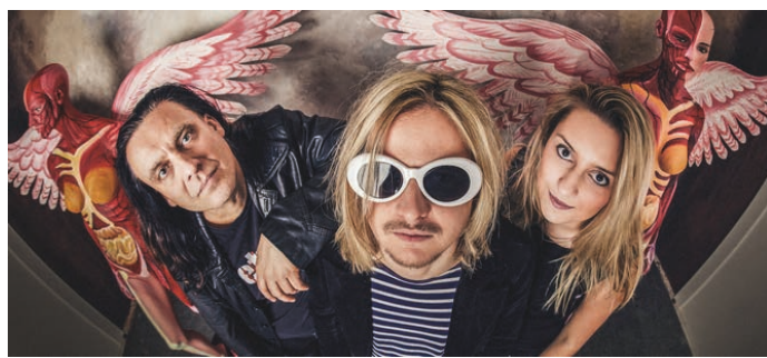
Nirvana tribute - In The Name Of Cobain.

Předskokanem bude rocková kapela z Lanškrouna Crash Hard, která hraje podařené covery, od Bon Jovi přes Adele až po české odrhovačky.