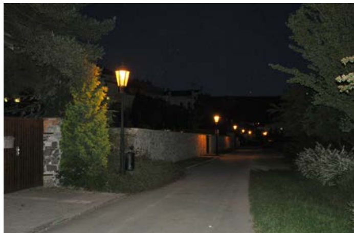
Noční osvětlení v Hranicích.

A co zeleň a lesy. Ne každý ví, že máte na starosti i městské lesy?