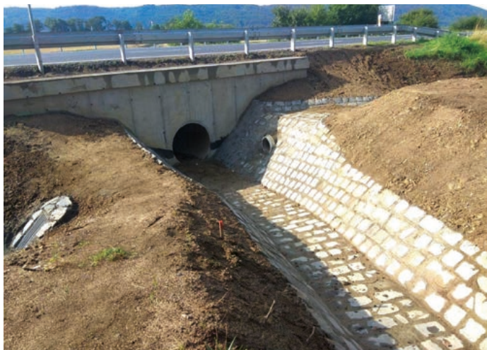
Propustek pod silnicí I/47 v Drahotuších.