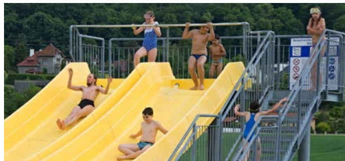
Plovárna Hranice.

od 1. ledna 2018, kdy bylo ve městě rozmístěno třináct nových parkomatů. Pro řidiče to znamenalo zejména rozšíření možností úhrady parkovného jak hotovostí, tak platební kartou nebo mobilní aplikací. Z pohledu správy města Hranice jde zároveň o první městský systém, který pracuje s konceptem tzv. Smart City (princip, který má sloužit hlavně občanům).