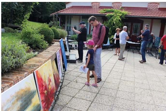
V areálu Staré střelnice budou začátkem července tvořit obrazy umělci z několika zemí.