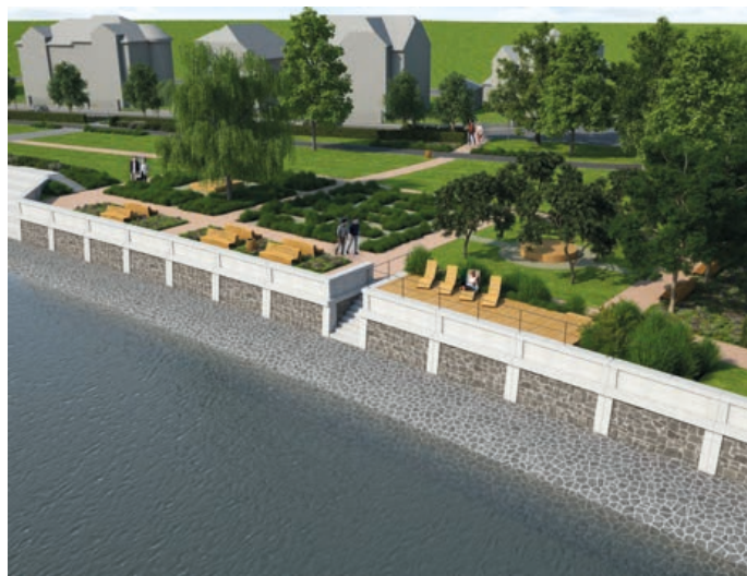
Vizualizace možné podoby nábřeží.

ný chráněný subjekt. Podle aktuální projektové dokumentace jsou Povodím Moravy investiční náklady akce „Bečva, Hranice – PPO města“ vyčísleny na 79 milionů korun. Na stavbu poskytuje dotaci Ministerstvo zemědělství ve výši maximálně 85 % ze stavebních nákladů. Tento způsob financování předpokládá, že zbylých 15 % a všechny další neuznatelné náklady doplní chráněný subjekt, tedy město. Po vzájemné dohodě mezi městem a Povodím Moravy byl podíl města na stavebních nákladech odhadnut rámcově na 14 milionů korun. (bak)