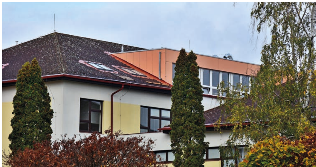
Nové třídy si vyžádaly úpravu střechy.