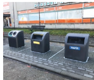
Podzemní kontejnerová stání v Drahotuších.

podařilo vybudovat v Drahotuších. Vybudováním propustku pod silnicí I/47 v Hranické ulici o průměru 1,2 metru se obnovilo původní propojení hlavního odvodňovacího zařízení s mlýnským náhonem. Na pozemcích města byl také vyhlouben meliorační příkop, který odvádí povrchové vody z Hranické ulice. Zamezí se tak zaplavlávání nemovitostí a pozemků v uvedené lokalitě.