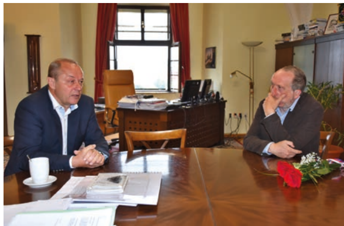
Starosta města Hranic Jiří Kudláček se 10. června krátce setkal s poslancem Parlamentu ČR Václavem Klausem ml., členem parlamentního Podvýboru pro regionální školství a předsedou politického hnutí Trikolóra.