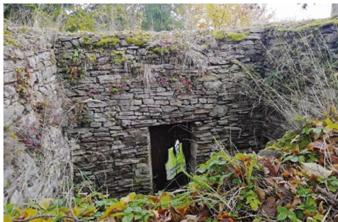
Jednou ze zastávek je například torzo železné rozhledny, která byla vystavěna v roce 1929 potštátským hrabětem Zikmundem Desfours-Walderodem. Z rozhledny byl ve své době výhled na Hostýn, Beskydy, ale i Nízké Tatry.