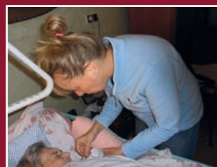
Charita Hranice poskytuje také domácí hospicovou péči.

Pastorační asistentka – podporuje nemocného i rodinu, doprovází je v této těžké životní situaci