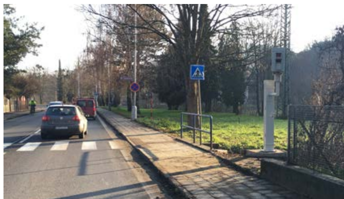
Počet řidičů, kteří v tomto úseku překračovali rychlost, poklesl za dva roky používání radaru téměř na desetinu.

Vždyť jen na běžné opravy komunikací se v letošním roce předpokládají výdaje přibližně 8,5 milionu korun. Pokud bychom k tomu připočetli chodní-