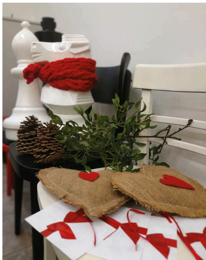
Na Masarykově náměstí budou k vidění velké vánoční šachy a také strom plný vánočních myšlenek, zajímavostí a nápadů. Na výzdobě náměstí se podílely Dům dětí a mládeže Hranice, Květinářství Burešová, Město Hranice a Městská kulturní zařízení Hranice. Poděkování za poskytnutí některých materiálů patří také Krejčovství Hugo.