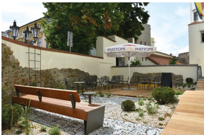
Současná podoba předzámčí.

Předzámčí dostalo novou tvář. Dvůrek na levé straně u jižního vstupu do zámku se proměnil k lepšímu. Podle projektu architekta Tomáše Kočnara zde vzniklo upravené místo pro venkovní kavárenské