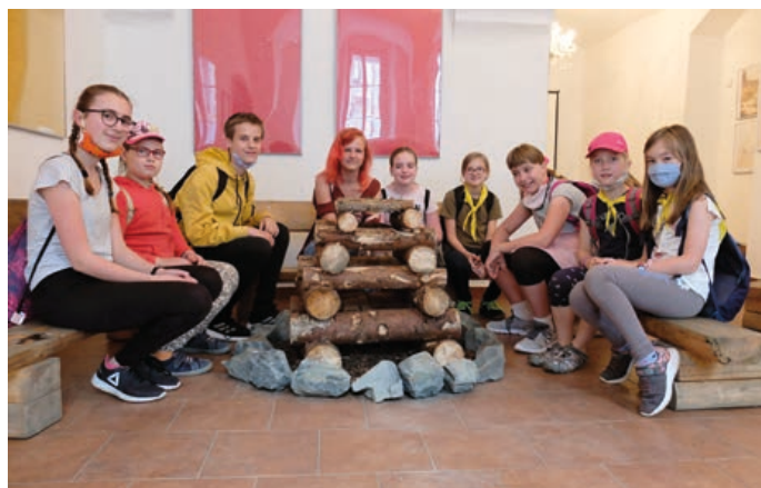
Táborová hranice je postavena, výstava může začít.

Ke skautským táborům patří i v dnešní době podsadový stan a indiánské týpí. A to nechybí