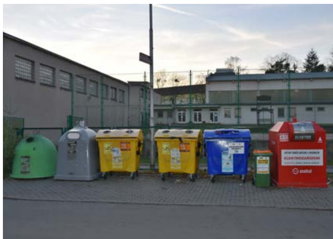
Hraničtí občané mají široké možnosti třídění odpadu.