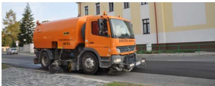
V létě Ekoltes čistí ulice, aby se snížila prašnost.

silničních vpustí a dešťové kanalizace včetně přípojek, budování a montáž pevných dopravních značek i přenosného dopravního značení, vyznačuje vodorovné dopravní značení.