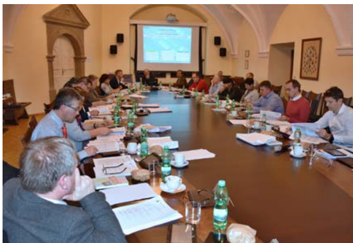
Tématem jednání bude první úprava rozpočtu, který zastupitelé schválili v prosinci.

První letošní jednání zastupitelstva města Hranic se uskuteční ve čtvrtek 20. února od 16 hodin na zámku v zasedací síni Městského úřadu v Hranicích, Pernštejnské náměstí 1.