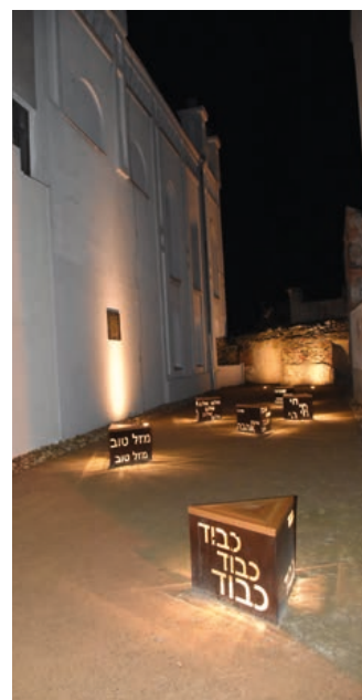
Proluka u synagogy v novém kabátu.