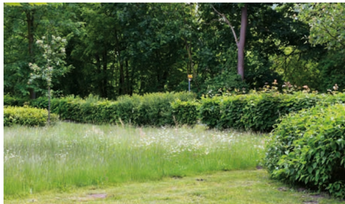
Přírodní biotop v Sadech Čs. legii.

V Hranicích jsou pro přírodní biotopy zatím vyčleněny následující pozemky, na kterých budou ponechány nepokosené části. Jde o svah a rovinu nad akumulací nádrží u Veličky pod bývalou hasičárnou, dále partii na Smetanově a Kropáčově nábřeží, úseky nad gará-