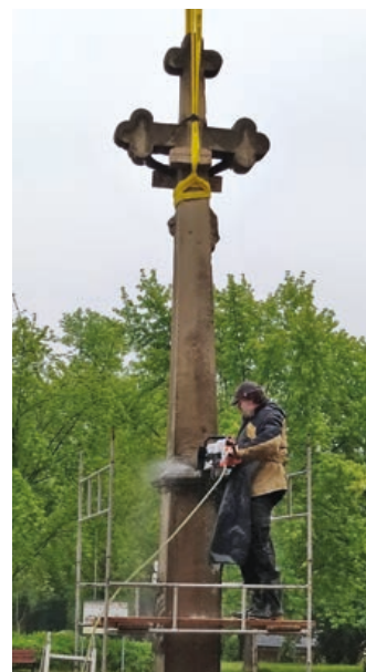
Snímání kříže nebylo jednoduché.

V roce 2017 proběhla také odborná restaurace sochy Panny Marie Immaculata na Masarykově náměstí. Socha, sloup i zábradlí prošly důkladnou očistou a opravou. Celá akce stála necelých 660 tisíc korun a na rekonstrukci městu přispěl Olomoucký kraj částkou 200 tisíc korun. (bak)