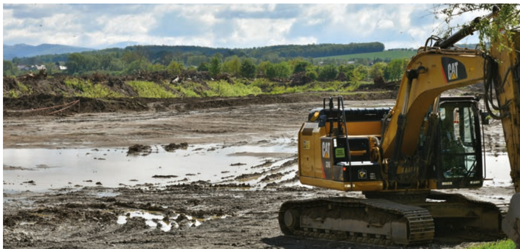
Rozšiřování koryta Bečvy provádějí rozsáhlé zemní práce. Takto to vypadalo u Ústí.

Oblast Ústí a níže položené obce je ohrožována už při průtocích tzv. pětileté povodně. Tvarové a materiálové řešení vychází z přirozeného vinutí řeky Bečvy a i po dokončení stavebních prací zůstane tok otevřen pro další samovolný přirozený vývoj. „Kromě protipovodňového účinku tato opatření výrazně zlepší hydromorfologický stav toku i údolní nivy Bečvy. Další efektem bude posílení místního ekosystému a omezení šíření nepůvodních druhů. Úpravou dojde také ke zlepšení hydraulických podmínek při chodu ledů v toku a tedy k dalšímu snížení