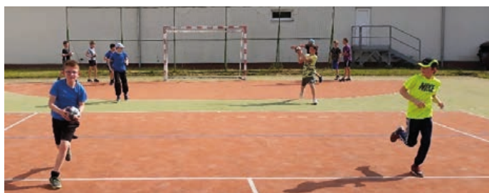
Házenkáři začali trénovat.

V reakci na upozornění vlády, že sportoviště budou v jistém režimu otevřena k 11. květnu, jsme se přesto ještě týden rozhodli vyčkat a naše sportoviště jsme zprovoznili od 18. května, ale jen pro členy TJ Cement Hranice.