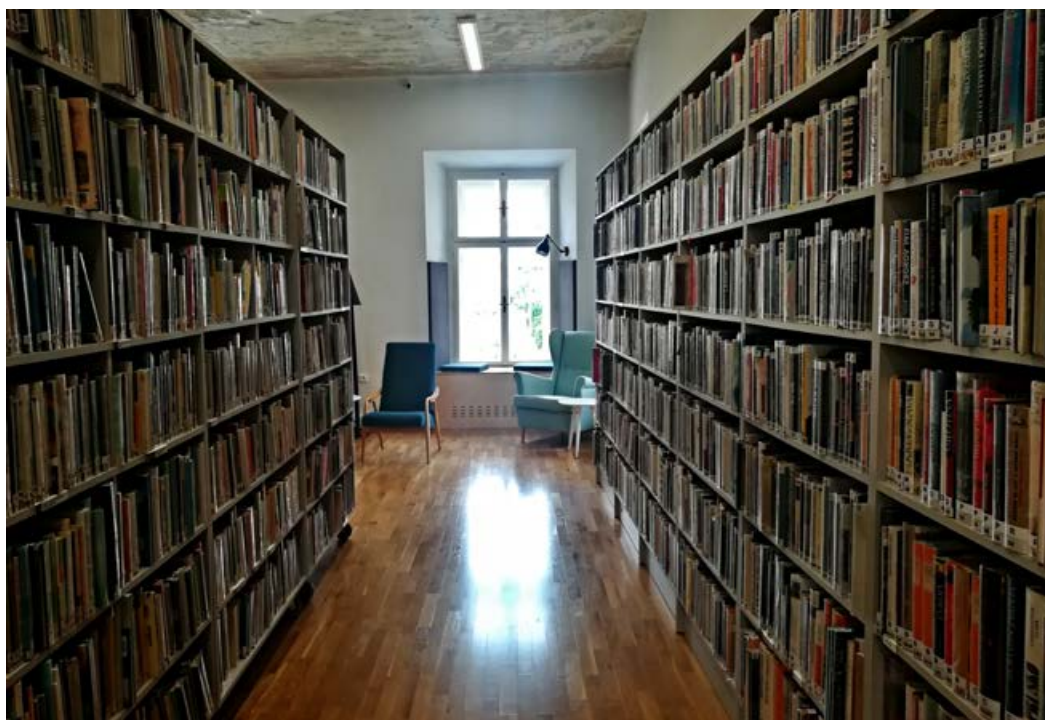
Míst, kam se dá u nás zašít s knížkou nebo časopisem, je víc a každé má svoje kouzlo.

Věříme, že se Vám naše nové webové stránky budou líbit a jednoduše u nás najdete to, co hledáte. Přejeme Vám příjemné surfování a věříme, že nezůstane jenom u návštěvy našeho webu, ale přijдете i osobně. Třeba si jen