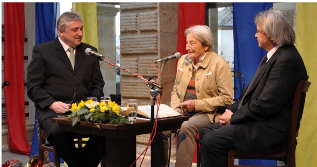
Před deseti lety jsme na vyhlášení nejlepších sportovců přivítali Danu Zátopkovou.