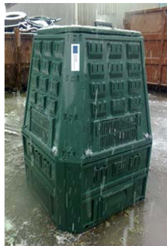
Takovéto kompostéry město rozdávalo v roce 2017.