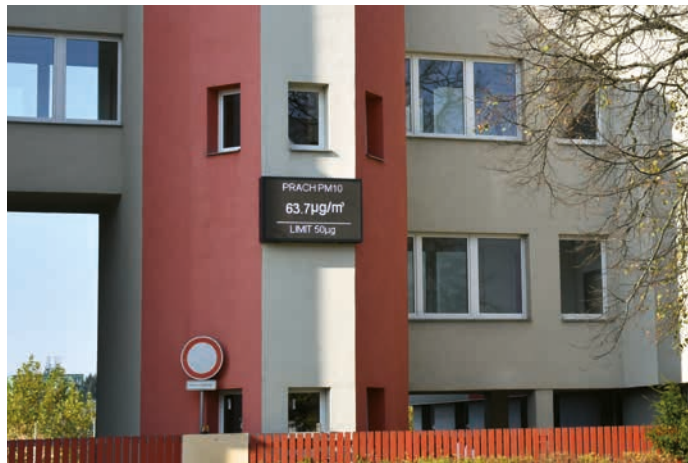
Aktuální informace o kvalitě ovzduší jsou také na velké obrazovce na Trídě 1. máje.

kouř z hoření PS může dráždit oči a sliznice.