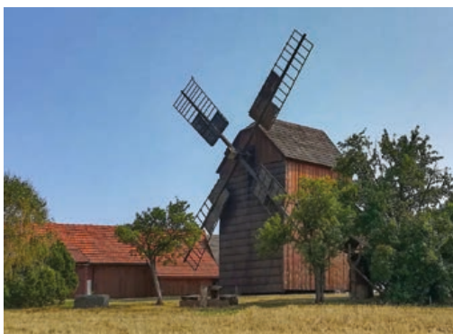
Větrný mlýn v Partutovicích.