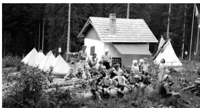
Pospolitost skautů se tvoří jak společnými zážitky, tak časem. Letošní rok skauti oslaví 100 let.