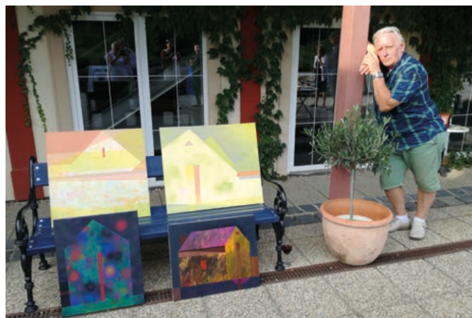
Díla výtvarníků budou k vidění v Galerii Severní křídlo zámku v Hranicích, kde se uskuteční výstava Hraniceum.