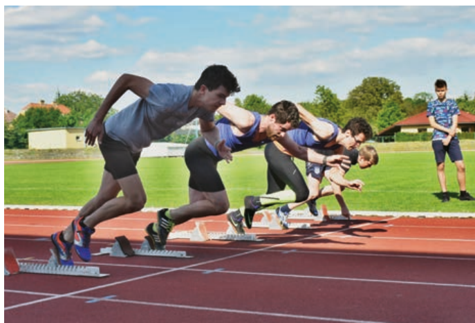
V Hranicích se závodilo v osmi disciplínách.

V Hranicích se závodilo v osmi disciplínách, startovaly kategorie od mladších žáků nahoru. Celkem se účastnilo 47 hranických atletů a k vidění byly nejen kvalitní výkony, ale i krásné souboje. Letošní atypická atletická sezóna tak byla oficiálně zahájena.