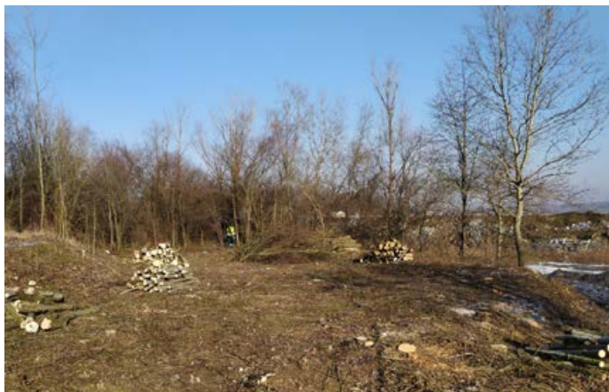
Příprava na 3. etapu.