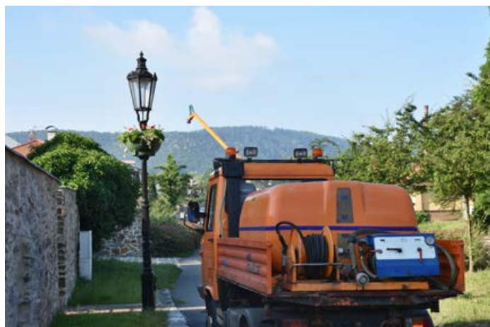
Květinová výzdoba město zkrášluje, vyžaduje ale péči.