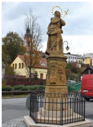
Zrestaurovaná socha Panny Marie Bolestné.