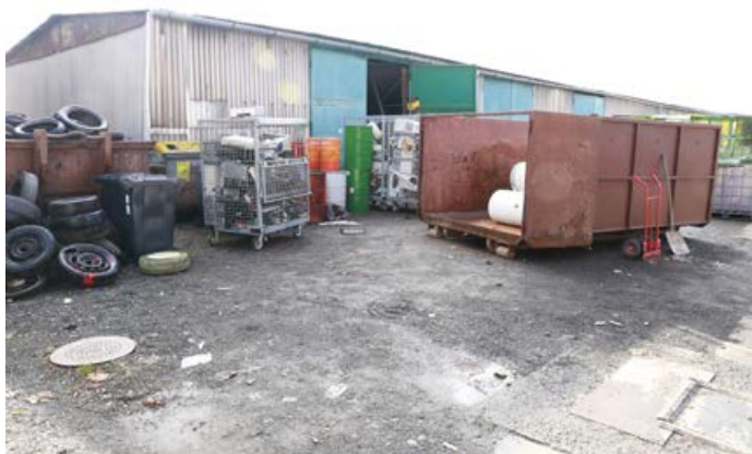
Stávající stav areálu.