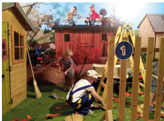
Pat a Mat jistě ocení pomoc od malých i velkých.

Hranické muzeum chystá interaktivní výstavu, která vás zavede do světa dvou pověstně nešikovných kutilů známých také jako Pat a Mat. Pro tuto dvojici není žádná komplikace překážkou a své kutění si umí patřičně užít. Těšit se můžete na animáční dílnu s praxinoskopem, originální scény a loutky z oblíbeného večerníčku, či na hru a fotokoutek „Na návštěvě u Pata a Mata“. Seznámíte se s historií natáčení