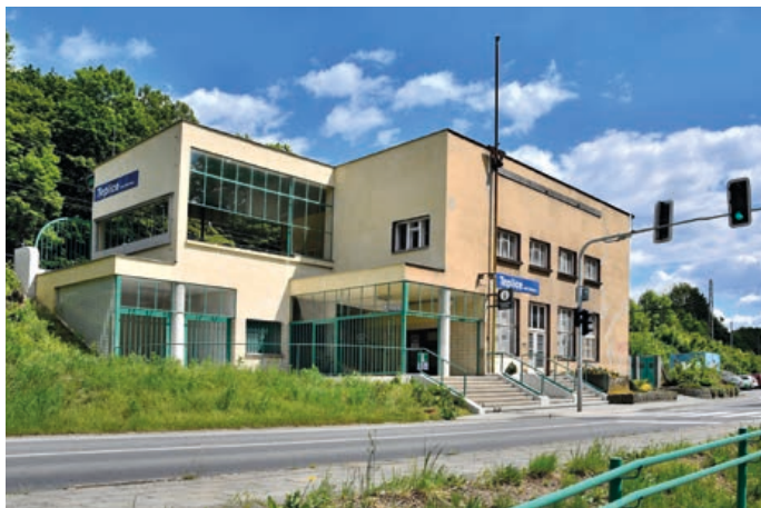
Funkcionalistická stavba nádraží v Teplicích nad Bečvou prohlédla. V přízemí je Infocentrum Propast, z lázeňského parku se k němu návštěvníci pohodlně dostanou přes přechod opatřený semaforem.

Infocentrum Propast je zde pro vás každý den kromě pondělí. Od úterý do pátku je otevřeno od 10 do 16 hodin. O víkendu od 9 do 12 hodin a od 12:30 do 17:30 hodin.