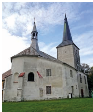
Kostel sv. Bartoloměje s působivou atmosférou se nachází v historickém centru Potštátu.