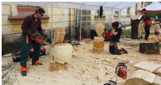
U zámku se uskuteční řezbářské sympozium Hranický řez.

Akce vyvrcholí v neděli 9. srpna předáním hotových děl městu a doprovodným programem pro návštěvníky. Pro více informací sledujte web www.kultura-hranice.cz . (mk)