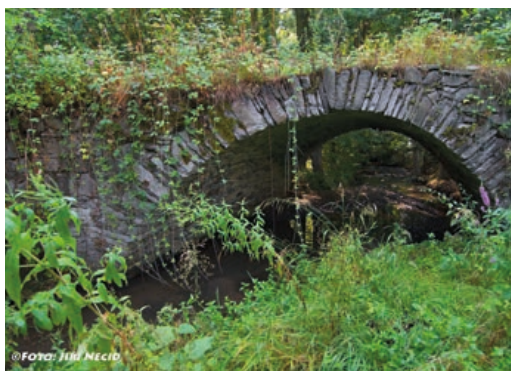
Římský most.

Hranicko lze také nazvat rájem minimuzeí, protože snad v každé vesničce v okolí najdete nějaké zajímavé minimuzeum. Další lákavá místa a tipy na výlety najdete na webu www.infocentrum-hranice.cz . (red)