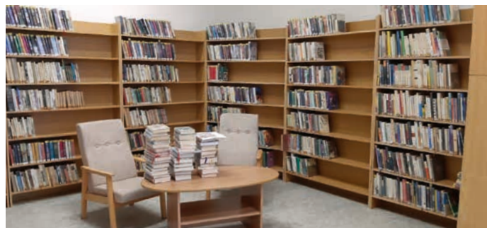
Věříme, že upravené prostory ve Velké přilákají další čtenáře.

TIRÁŽ: Hranický zpravodaj č. 12/2020 - Periodický tisk územního samosprávného celku. • Měsíčník • Vychází 1. prosince 2020 • Ročník VI. • Vydávající Městská kulturní zařízení Hranice, příspěvková organizace se sídlem Masarykovo náměstí 71, 753 01 Hranice, IČO: 71294686 • Grafická úprava a tisk: © KLEINWÄCHTER holding s.r.o., Čajkovského 1511, 738 01 Frýdek-Místek • Náklad: 8 400 ks • Distribuce: Česká pošta, zdarma do všech domácností v Hranicích a místních částí • Redakce: tel. 581 607 479, e-mail: infocentrum.zamek@mkz-hranice.cz • Editoři: Ing. Nada Jandová, Ing. Petr Bakovský • Korektury: Mgr. Renata Doleželová • Hranický zpravodaj na internetu: www.mesto-hranice.cz/cs/televize-tisk/ • mkz-hranice.cz/hranicky-zpravodaj • Zaregistrováno Ministerstvem kultury ČR pod zn. MK ČR E 22143 • Redakce si vyhrazuje právo příspěvků krátit • Účastí na programech pořádaných Městskými kulturními zařízeními Hranice, p. o., IČO 71294686, dává jejich účastník souhlas s užitím pořízených fotografií a videodokumentace pro propagační materiály organizace (webové stránky, Hranický zpravodaj, tiskoviny, Facebook). Souhlas se dává do odvolání.