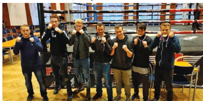
Hraniční kickboxeři.