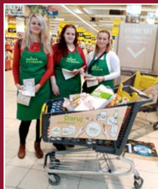
Charita Hranice spoluorganizuje také potravinovou sbírku.

V podzimních měsících s Potravinovou bankou Olo-