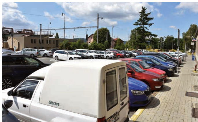
Parkoviště před nádražím bývá zaplněné.

V současné době je cyklo doprava na nádraží obtížná i proto, že zde není možné kolo bezpečně