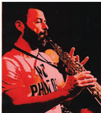
Evropské jazzové dny okem místního fotografa.

Výstava hranického fotografa Milana Kašovského nabídne osmdesát fotografií, které se budou řídit do dvou témat. Prvním tématem budou stylizované, ne-tradiční fotografie z Evropských jazzových dnů v Hranicích. Druhým tématem budou fotografie z autorových cest po světě, například z Izraele. Výstava se koná k výročí autorových narozenin.