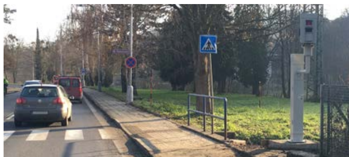
Ukázalo se, že radary významně snižují rychlost.

po Býškovcích stává již druhou obcí, pro kterou město Hranice provádí měření rychlosti. V Býškovcích jde ale o úsekové měření. Vliv radaru na bezpečnost dopravy ukazují výsledky dvou let provozu. Zatímco při zahájení měření bylo na hlavním tahu na Valašské Meziříčí denně zaznamenáno okolo 600 případů překročení rychlosti, dnes se jedná zhruba o 70 přestupků denně. (bak)