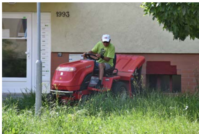
Sekačky Ekoltesu v činnosti.