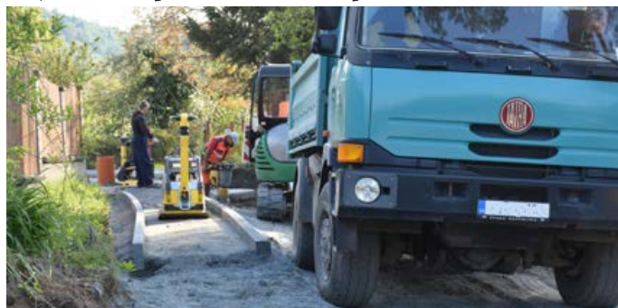
V Havlíčkově ulici probíhá rekonstrukce i budování nového chodníku.

Rekonstrukce Havlíčkovy ulice byla zahájena již v loňském roce, kdy se týkala zejména opěrných zdí, řešilo se i odvodnění. Letos přijde na řadu samotný povrch silnice. V ulici také probíhaly nezbytné přeložky inženýrských sítí, například veřejného osvětlení a nízkého napětí elektrického vedení. V roce 2018 zde probíhala výstavba kanalizace. (bak)