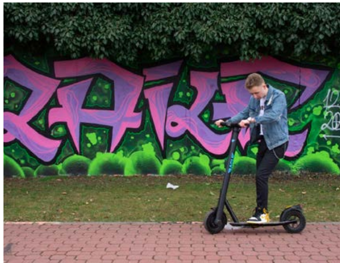
Takto budou vypadat nové elektrokoloběžky.

Po jízdě pak koloběžku může uživatel nechat kdekoliv (před restaurací, obchodem, v parku, u nádraží nebo před školou), ve vymezeném území města Hranic. Přesně to jsou Hranice I - Město s propojením do lázní Teplice nad Bečvou, dále