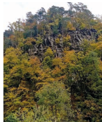
Potštátské skalní město je nádhernou, i když opomíjenou turistickou lokalitou.