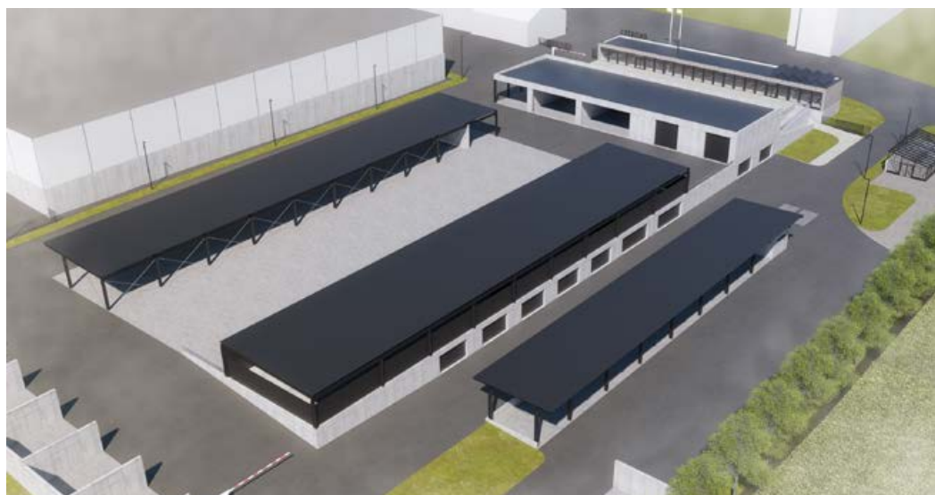
Vizualizace budoucího areálu Ekoltesu.