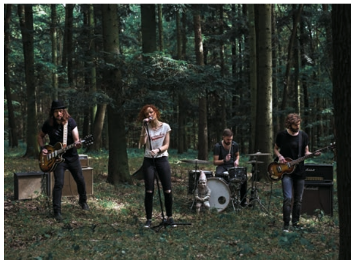
Letošní Hranické kulturní léto odstartuje v Zámecké zahradě kapela November 2nd.

Jejich píseň Change the World se dostala do čela hitparády rádia Rock Zone, píseň Believe