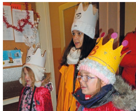
Hranické domácnosti navštíví Kašpar, Melichar a Baltazar.