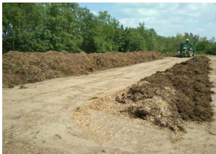
Bioodpad končí na kompostárně Ekoltesu.