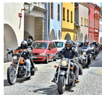
V ulicích burácely silné stroje.

Zní to neuvěřitelně, ale letos to bylo už pojedenácté, co zaburácely na hranickém náměstí nablýskané motorky, na nich muži v kůži, kteří přijeli na motorářskou mši, a veřejnosti nabídli přehlídku silných strojů. K vidění byly motocykly všech značek. Lidé si je mohli prohlédnout a po mši a požeňání jezdců a jejich strojů mohli sledovat spanilou jízdu. Připomeňme si akci, která se konala v sobotu 30. května, alespoň fotografiemi. (red)