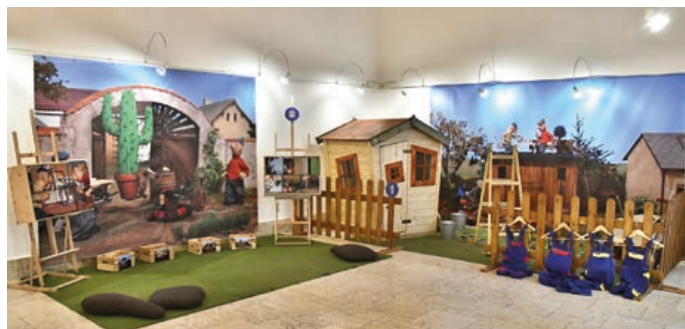
Na téměř dva měsíce výstava Pat a Mat osířela kvůli opatřením v rámci nouzového stavu.

O tom, že se výstava líbila, svědčí nejen vysoké číslo návštěvnosti, ale také krásné zápisy v návštěvní knize výstavní síně na Staré radnici a rovněž fakt, že se někteří návštěvníci na výstavu opakovaně vraceli. Pohrát si, zhlédnout film, projít si všechny zábavné úkoly – to se nedalo stihnout během jedné návštěvy. Pata a Mat jsme v Hranicích rádi přivítali a přejeme této dvojici poustu dalších, stejně báječných návštěvníků, jako jste byli vy. (dh)