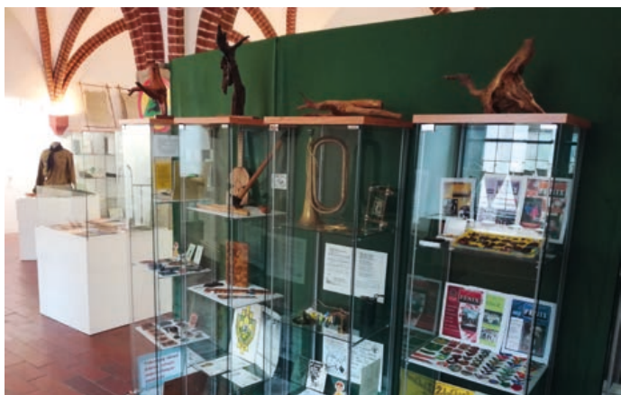
Exponáty výstavy „Bud' připraven!“ těsně před zahájením.

Výstava s názvem „Bud' připraven!“ zaplnila od čtvrtka 25. června výstavní sály na Staré radnici v Hranicích. Připomíná výročí 100 let skautingu v Hranicích a zavítat na ni mohou zájemci po celé léto až do neděle 20. září . Místo obvyklé vernisáže proběhne dernisáž, a to v pátek 18. září v 17 hodin .