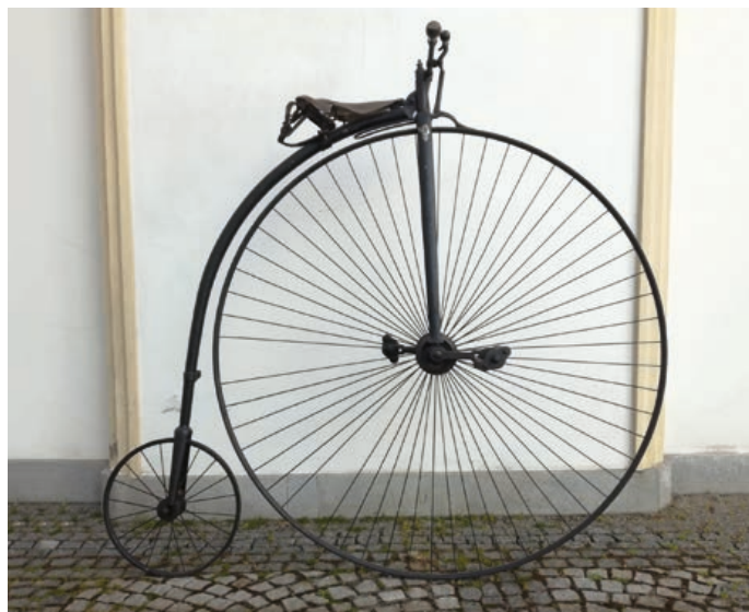
Vysoké kolo Howe z roku 1885, které je ve sbírkách hranického muzea.

K obdobnému vynálezu došlo i ve Francii, kde ho mechanik Nicéphore Niepce nazval vélocipède (rychlá noha), a v Rusku údajně sestavení prvního primitivního kola místnímu nevolníku vyneslo od jeho pána svobodu.