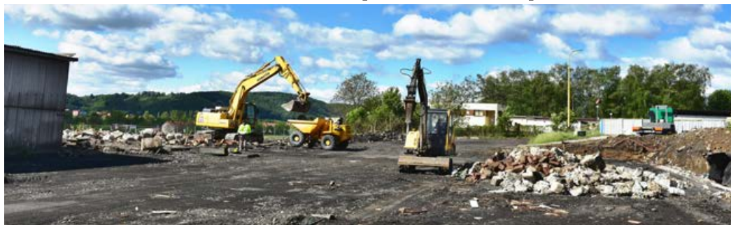
V areálu Ekoltesu již „řadí“ těžká mechanizace.

„Největší změnou bude, že půjde vlastně o takový kruhový objezd. Nebude tedy už docházet k couvání a otáčení, což bylo v dosavadních stísněných prostorách hodně komplikované. Vykládka odpadu se stane mnohem pohodlnější, protože