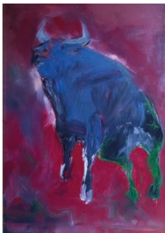
Umělkyni se podařilo zachytit energii býka pouze svými prsty.

Již při studiích na Střední umělecké škole a posléze na Fakultě umění Ostravské univerzity v Ostravě bylo zřejmé, že se jedná o vícestranně talentovanou a nekonformní osobnost. Vedle