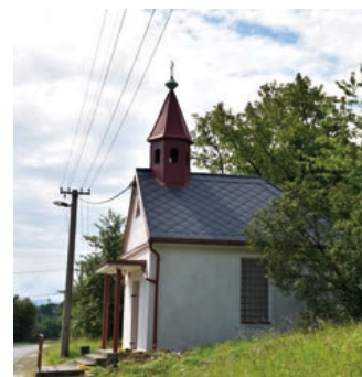
Kaplička ve Valšovicích.

Akce stála přibližně 250 tisíc korun a projekt byl spolufinancován z příspěvku Olomouckého kraje.