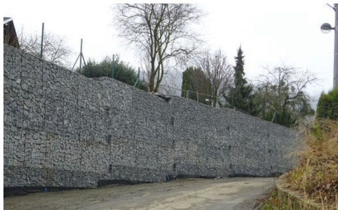
Nová opěrná zeď v Havlíčkově ulici.

Rozběhla se také rekonstrukce Havlíčkovy ulice . Začalo se v červenci nezbytnými přeložkami inženýrských sítí, a to jednak veřejného osvětlení, jednak nízkého napětí elektrického vedení. Poté bylo zahájeno budování