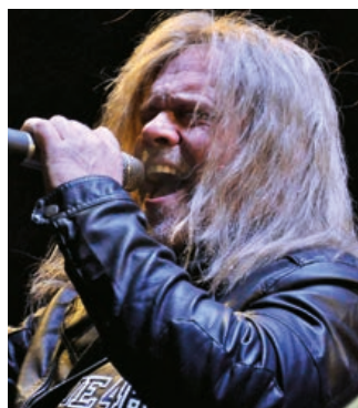
Kabát Tribute nabídne skvělou show.

Hudební skupina Kabát Tribute vznikla v roce 2008 jako pocta skupině Kabát a dala si za cíl šířit její slávu. Velký důraz