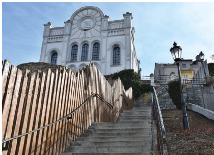
Do konce září budou Židovské schody uzavřené.

Schodiště, které je ve špatném technickém stavu, však bude muset být po dobu oprav uzavřeno. Po dobu rekonstrukce proto, prosím, využívejte náhradní tras, například přes Zámeckou zahradu, schody od Zámeckého hotelu ke Šromotovu náměstí nebo ulici 28. října. Děkuje se za pochopení.