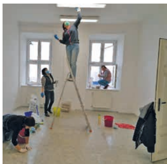
Ve Velké se malovalo a uklízelo.

Marie Jemelková, Městská knihovna Hranice