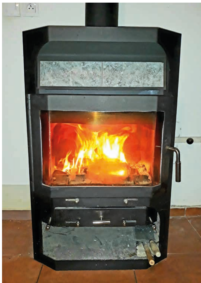
I v krbových kamnech nebo krby se dá topit ekologicky.

Dvoustranu připravili: Petr Bakovský, Michal Kočnar