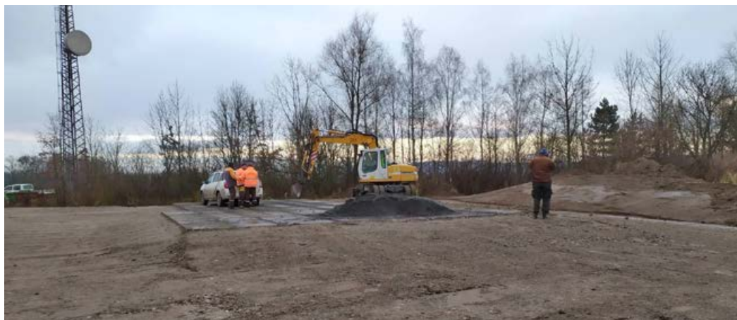
Zpevněná plocha na skládce.

To je další, neméně významná akce, která nás čeká. Městská skládka na Jelením kopci se nám velice rychle plní. 2. etapu čeká