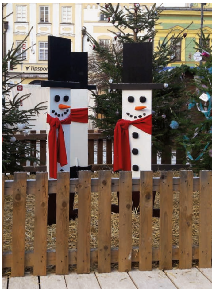
Svůj koutek budou mít na náměstí také sněhuláci, chybět nebude ani zvonička pro štěstí.

Vánoce budou tentokrát jiné, ale určitě nám i přesto nabídnou krásné zážitky. Užijme si je tedy v pohodové atmosféře. (nad)