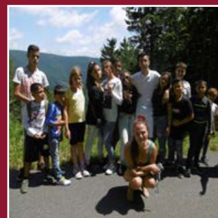
Pro děti a mládež pořádá Fénix také prázdninové výjezdní akce.

Naši službu poskytujeme v Hranicích již od roku 2007 a v Lipníku nad Bečvou od roku 2014 za výborné vzájemné spolupráce s oběma jmenovanými městy. Práce s dětmi je radost i starost, ale odměnou nám jsou pozitivní ohlasy jak od našich uživatelů, tak od běžné společnosti i různých spolupracujících organizací. Uvědomujeme si, že s výchovou, správným vedením a nastavením správných morálních hodnot je nutné začít