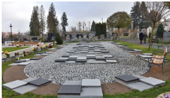
Nové pietní místo na hřbitově.

Další památkou, která dostala nový kabát, byla kaplička Blaho-