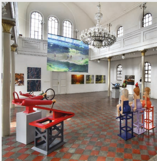
Ještě do neděle 19. července lze zhlédnout výstavu dvou významných umělců, Oldřicha Šembery a Jiřího Žlebka. Výjimečný prostor Galerie Synagoga nabízí zajímavou výstavu. Barevné a vtipné sochy a objekty Jiřího Žlebka ocení nejen znalci umění, ale i děti. Zvláště když si budou moci s některými sochami „zahýbat“.