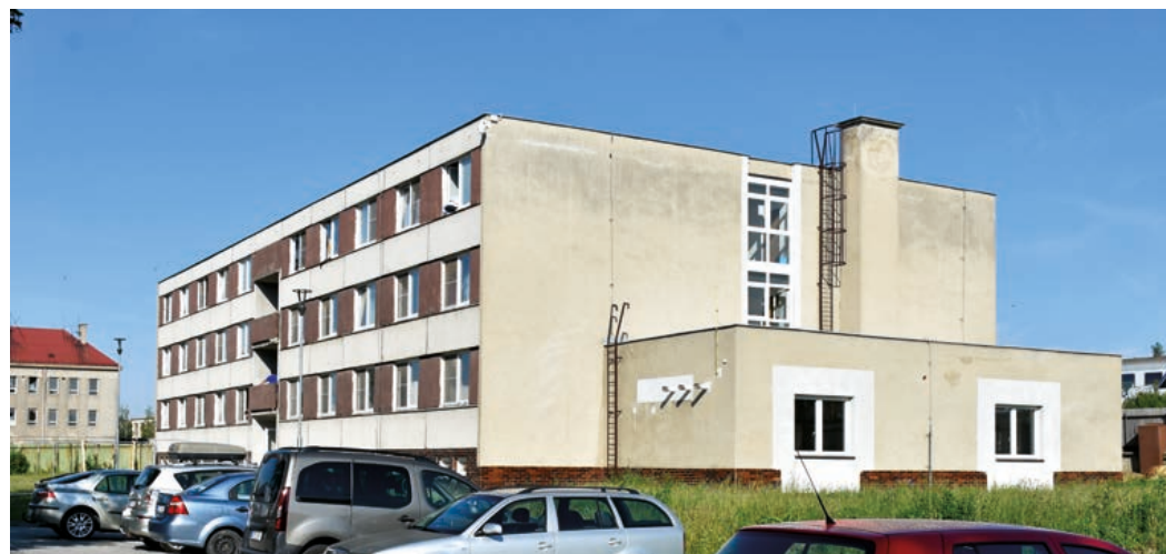
Městská ubytovna a nolehárna ELIM.

Kuchyně Domova seniorů dostala novou vzduchotechniku. Postupná modernizace Domova seniorů pokračovala letos novou vzduchotechnikou