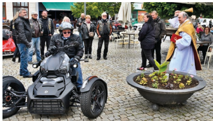
Hranický farář žehná motorkám.