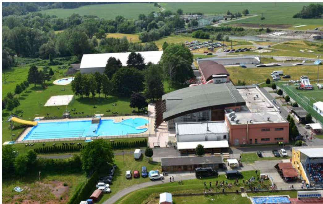
Nejen areál letního koupaliště, ale i Plovárnu má Ekoltes na starosti.

Ano, městské lesy, které spravujeme, mají přes 250 hektarů. Ty na mě působí velmi příjemně. Všichni víme, jak složitá a leckdy nepřehledná situace v českých lesích panuje. Zcela jinak je tomu v našich lesích. Správa lesa probíhá kontinuálně a efektivně, a tím je zaručena kvalita lesního hospodářství. Kůrovcová kalamita