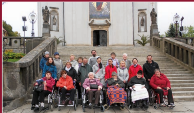
Klienti Charity Hranice se oblíbili pouť na Svatý Hostýn.

Klienti jsou aktivizováni, pomocí rozhovorů provádíme vzpomínkovou terapii. Osobní asistentka se snaží klienta začlenit mezi jeho vrstevníky, pracuje s jeho rodinou, s každým klientem individuálně plánuje. Asistentka klientovi pomáhá