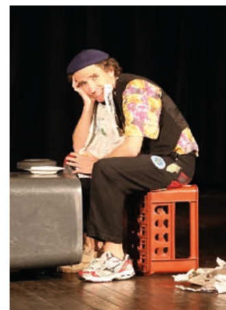
Hranické kulturní léto ukončí pantomimické představení Popelnice.

Milovníky divadla, pantomimy a humoru nadchne představení Popelnice z produkce Divadla Fortissimo. V humorně laděném programu rozehrává výrazná osobnost slovenské pantomimy Vlado Kulíšek řadu komických i poetických scének ze situace, která je ve své podstatě tragická – všední den bezdomovce, který obývá starou popelnici. Vlado Kulíšek vystupuje nejen v Evropě, ale také v USA, Číně, Vietnamu a dalších zemích. (red)