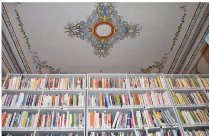
Obnovené malby na stropě knihovny jen září.

Kotelna v drahotušské škole byla již ve špatném stavu, proto došlo k výměně celého zařízení. Kotelna dostala nejen nový kotel, ale i bojler a další vybavení. Akce stála necelý 1,5 milionu korun. Podobnou sumu si vyžádala i druhá akce, kterou je oprava podlahy v suterénu. Zde dělala problém vysoká hladina spodní vody, takže k nové podlaze přibýly i sanační omítky.