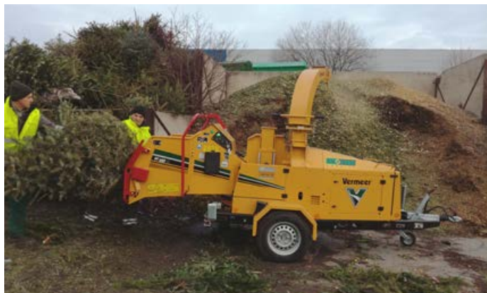
Při zpracování poražených stromů je štěpkovač neocenitelný.