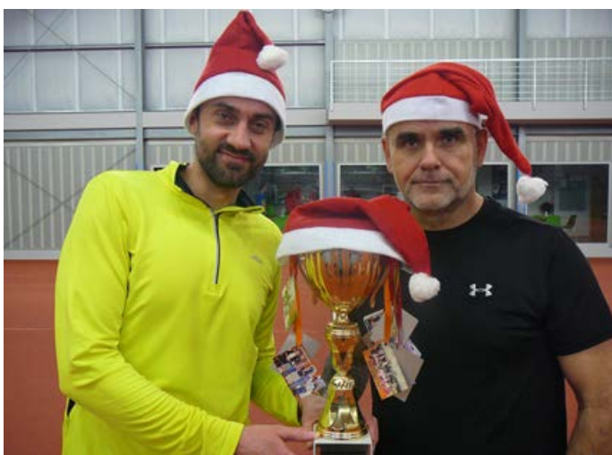
Vítězná dvojice si pod stromeček nadělila pěkný pohár.