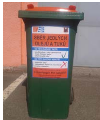
Město má kontejnery na oleje a tuky.

Mapu všech kontejnerových stání naleznete na webových stránkách společnosti Ekoltes Hranice ekoltes.cz/katalog/odpady-svoz-odpadu . (bak)