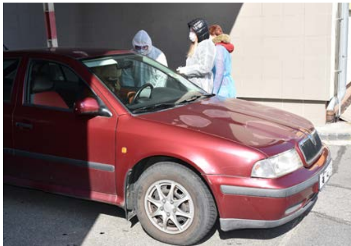
Žáci SZŠ při kontrole vstupu do hranické nemocnice.

„Dobrovolnická činnost našich žáků je průřezem ročníků i oborů. Naši žáci jsou zapojeni v dobrovolnické činnosti již od poloviny března. Jejich pomoc