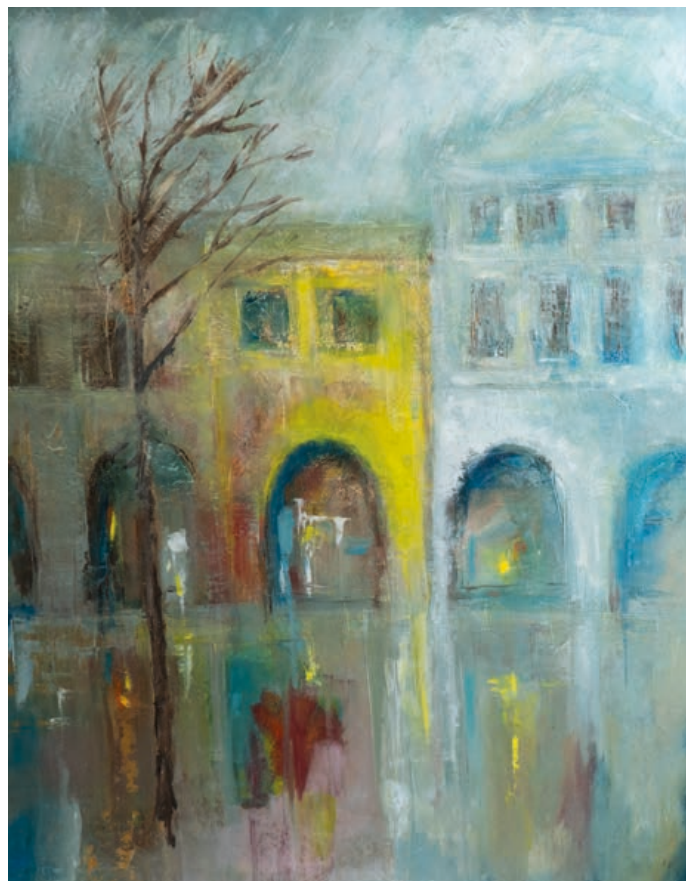
Podloubí v dešti.

16. 9. – 30. 10. 2020 - Odstíny – první výstavou Galerie Severní křídlo zámku po prázdninách budou obrazy hranické rodačky Renaty Doleželové. Její olejomalby, akryly a kombinované techniky zachycují témata inspirovaná přírodou, částečně i rodným městem nebo cestami po Evropě. Většina děl, pro která volí velká plátna, je ale abstraktního rázu. Zatím nejrozměrnějším dílem, které namalovala, je obraz vánoční zimní krajiny o velikosti 6 x 2 metry, určený pro divadelní představení živého betléma a vytvořený pro MKZ Hranice. Výstava pod názvem Odstíny bude zahájena vernisáží ve středu 16. září .