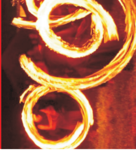
Ohňová show v Letním kině Neděle od 19:00 h