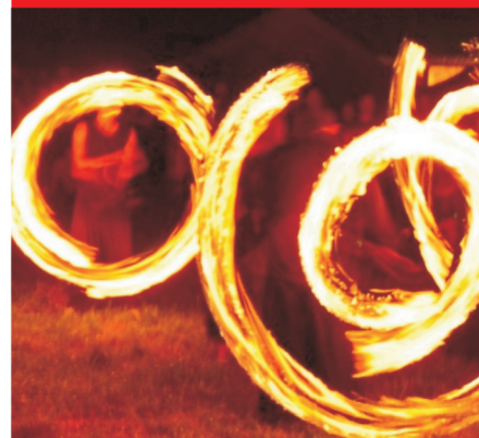
Ohňová show v Letním kině Neděle od 19:00 h