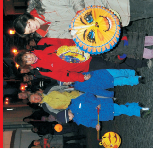
Lampionový průvod Neděle od 18:00 h