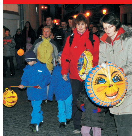
Lampionový průvod Neděle od 18:00 h