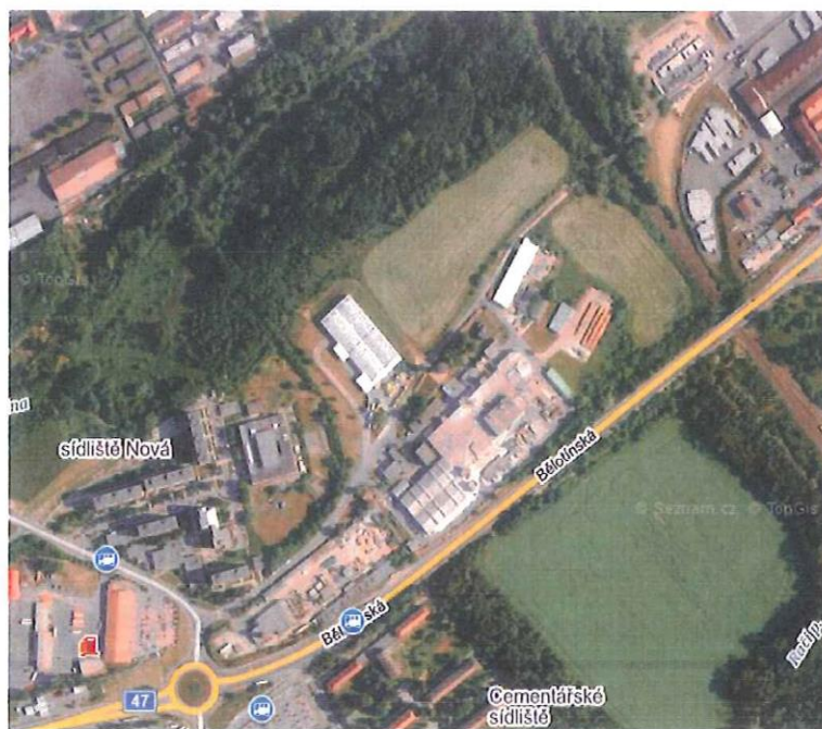
Obrázek č. 3 Vyhodnocení dopadu podnětu na změnu na zábor ZPF podle řešení obsaženém v návrhu Změny č. 1 ÚP Hranic