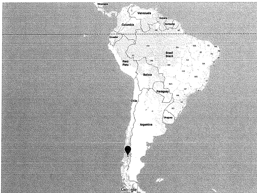
Dějště závodu Patagonman