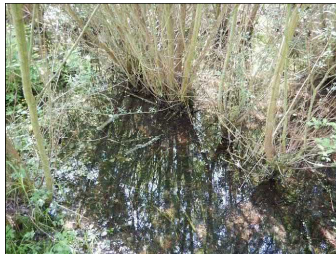
Tůňe jsou důležitým doprovodným typem biotopu v okolí lomu