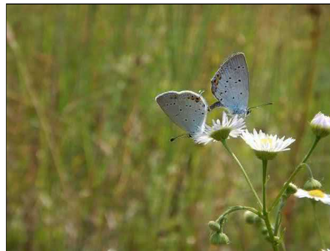
Kopulující pár modráška štírovníkového na louce v blízkosti lomu