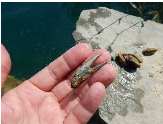
Klepato raka říčního z lomu Opatovice. V pozadí lastury slávičky mnohotvárné.