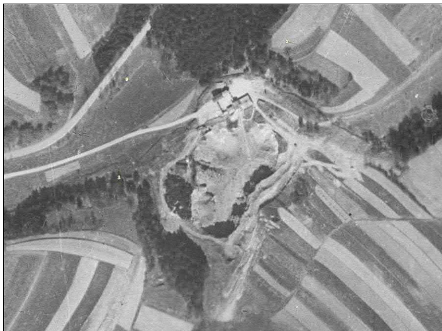
Obr. 1: Letecký snímek zájmového území z roku 1955 ukazuje existenci Opatovického lomu, absenci lomového jezera, převažující bezlesé okolí lomu a zemědělskou malodržbu okolních pozemků

Jak vyplývá z provedené analýzy leteckých snímků, v území docházelo v minulosti k poměrně dynamickým stanovištním a krajinným změnám. Přítomnost těžebního prostoru je patrna již na historickém poválečném snímku (1955, viz Obr. 2). Většina plochy lomu byla bezvodá, pouze po okrajích byly vytvořeny mělké vodní plochy typu tůní. Celá lokalita měla bezlesý charakter. Širší okolí již tehdy tvořila převážně orná půda, avšak s převažující malodržbou. Hojnější než dnes bylo zastoupení luk. Důlní jezero začalo vznikat po ukončení těžby v roce 1990. Ve stejné době také začíná okolí lomu zarůstat náletovým lesem. Jak je však patrné ještě z leteckého snímku z roku 2003 (viz obr. 3), okolí lomu mělo ještě v nedávné době spíše mozaikovitý ráz, ve kterém se střídaly různě velké porosty náletových dřevin s otevřenými plochami. K souvislému zárůstu okolí lomu lesem tak došlo až v posledních cca 10 letech (viz obr. 1).