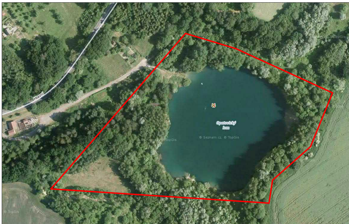
Obr. 1: Letecký snímek Opatovického lomu a vymezení zájmového území průzkumů

Lokalita Opatovický lom se nachází přibližně 1 km severně od obce Opatovice (okres Přerov, Olomoucký kraj). Jedná se o zatopený kamenolom s maximální hloubkou přes 30 m, ve kterém byla těžba ukončena v roce 1990. Po ukončení těžby lom zaplavila voda. Po opuštění se lom postupně zatápěl, jezero dosáhlo své současné rozlohy a hloubky v roce 1997, kdy sem byla svedena také povodňová voda. Lomové jezero má nepravidelně oválný tvar s rozměry cca 150 m x 140 m. Na dně lomu se nachází zatopené stromy, těžební technika (bagry) a čerpací stanice. Hlavní těženou horninou zde byla droba (usazená hornina podobná pískovci), která se využívala ve stavebnictví. Lom a jeho okolí je proto také významnou paleontologickou lokalitou. Lom je v současnosti využíván k příležitostnému koupání, potápění a také k rybolovu. Jeho bezprostřední okolí tvoří víceméně souvislý náletový les, v širším okolí však převažuje zemědělská orná půda. Jihozápadně od lomu se nachází významné luční refugium (viz Obr. 1). Ze severní strany lom obtéká Opatovický potok. Jižně od lomu se nachází průtočná nádrž rybníčního typu, která je primárně využívána k chovu ryb.