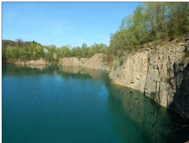
Pohled na východní stěny lomu porostlé již téměř souvisle dřevinnou vegetací