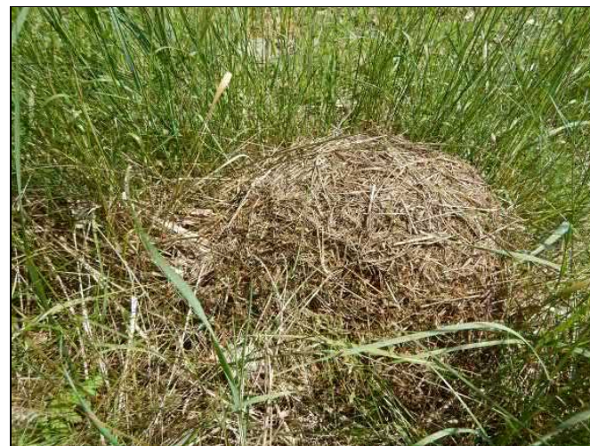
Kupa kolonie mravenců rodu Formica