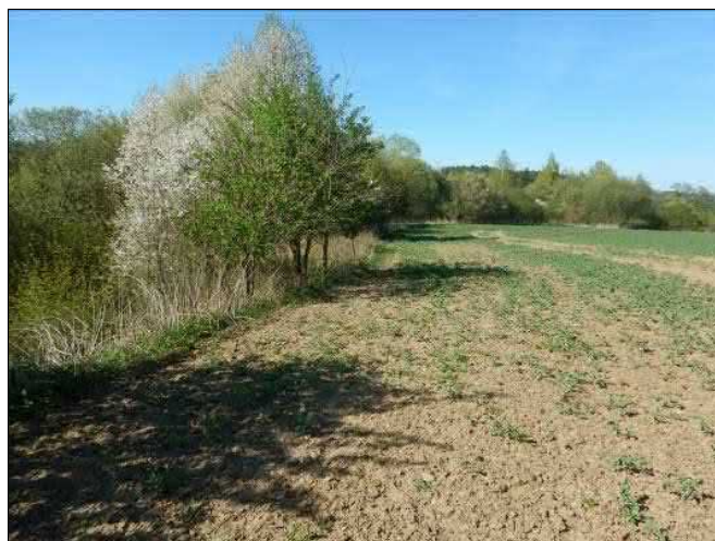
Ostrá ekologická hranice mezi okrajem lomu a okolní agrocenózou