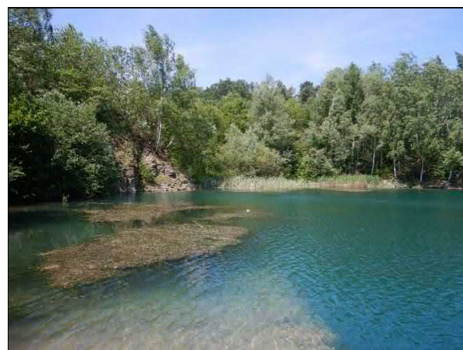
Vodní vegetace v lomovém jezeře je dosti vzácná. Porost rdestu kadeřavého, v pozadí porost orobince.