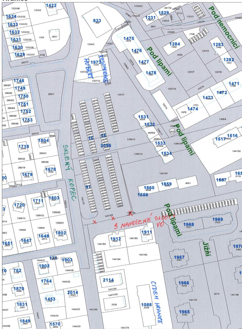
Mapa v měřítku 1:1500