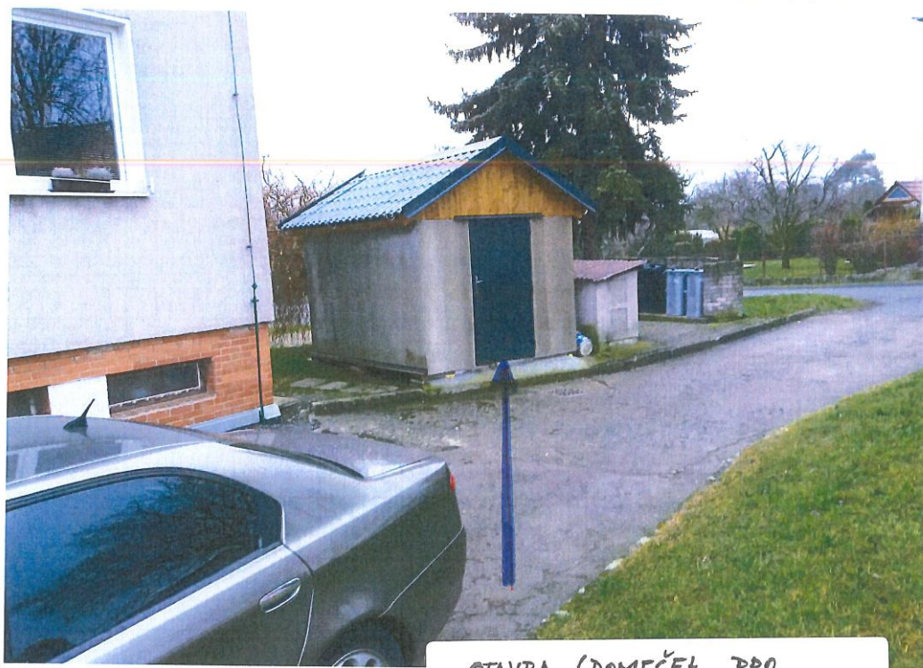
STAVBA (DOMEČEK PRO USKLADNĚNÍ KOL