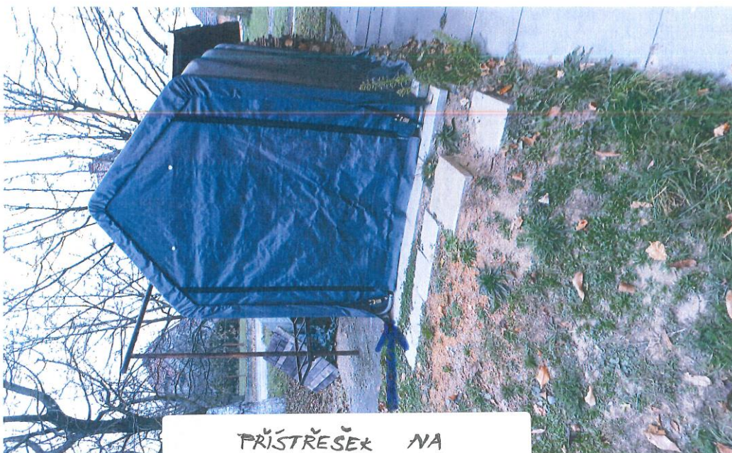
PŘÍSTŘEŠEK NA DŘEVO