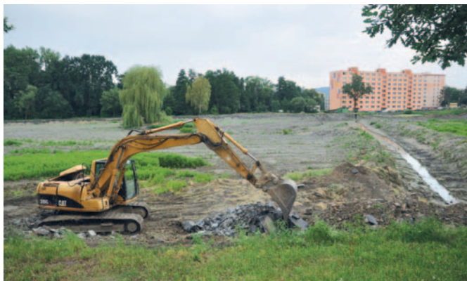
Těžké stroje upravují hráze rybníka Kuchyňka.

Soustavu nádrží tvoří dva Horní rybníčky, rybník Kuchyňka a stávající rybochovná sou-