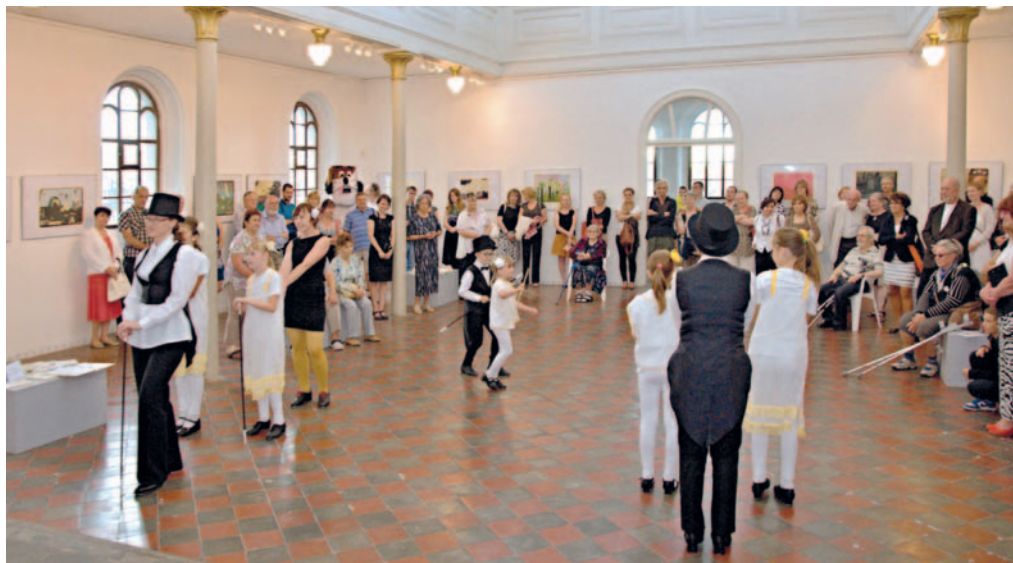
Na vernisáž grafické tvorby Jiřího Šalamouna zavítala téměř stovka návštěvníků.

Od 9. července patří galerie Synagoga grafické tvorbě Jiřího Šalamouna a jeho výstavě Roztržitý kompromis a jiné příběhy.