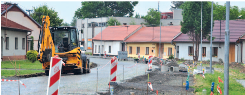
V Drahotuších se už pracuje.

Jedná se o společnou investici Olomouckého kraje a města Hranic na rekonstrukci průtahu Drahotušem, a to ulic Lipnická a Nerudova až po křižovatku hlavního tahu s ulicí K Nádraží. V tomto úseku musí nyní řidiči počítat s úplnou uzavírkou a na náměstí Osvobození musí mít na zřeteli, že došlo ke změně přednosti v jízdě. V rámci uzavírky dojde také ke změnám provozu autobusových linek dopravce ARRIVA MORAVA a.s.,