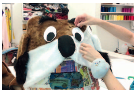
Ušití kostýmu Maxipsa Fíka sponzorovalo krejčovství Hugo.