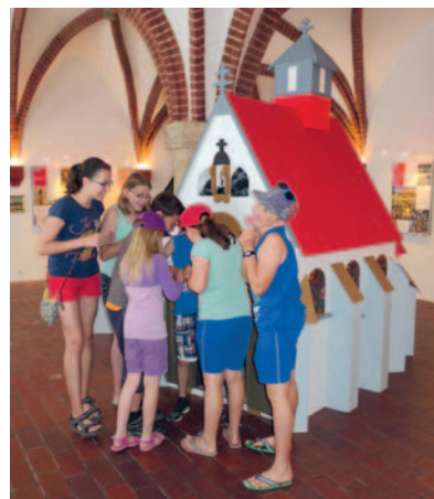
Po stopách Jurikovy veverky putovalo v zábavné hře na výstavě Tajemná Hranická madona už téměř sto návštěvníků.

tili, kde je ukrytý klíč od modelu Kostelíčka. „Tam je pro ně nachystáno sladké překvapení. Do hry se zapojují i dospělí a Veverčí stezku si prošla téměř stovka návštěvníků výstavy,“ doplnila kurátorka muzea Radka Kubíková. Kromě toho jsou pro děti připravené omalovánky, puzzle či kostky s motivy Kostelíčka. A do interiéru a okolí Kostelíčka mohou lidé nahlédnout i na výstavě, a to prostřednictvím krátkých filmů, které v muzeu promítají.