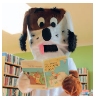
Maxipes Fík zavítal do knihovny, kde zjistil, že mají pětadvacet titulů ilustrovaných Jiřím Šalamounem.