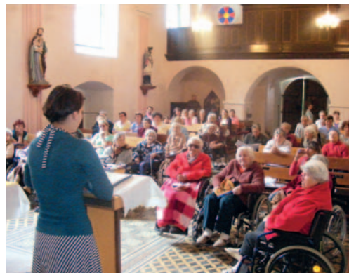
Prohlídky Kostelíčka v červenci využilo zhruba 60 lidí, převážně z hranického Domova seniorů.

nosti využily čtyři třídy z Gymnázia Hranice, jedna třída ze SSOŠ, pět tříd z hranických základních škol, návštěvníci z občanského sdružení Archa Community i veřejnost. Celkem za oba dny navštívilo poutní místo 300 lidí.