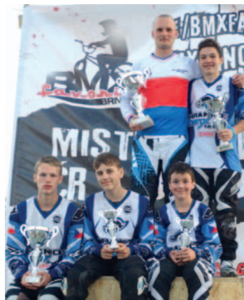
Z mistrovství si hraničtí jezdci dovezli čtyři poháry za stupně vítězů, včetně titulu mistra ČR.