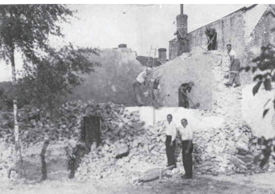
Bourání staré ledovny uvolnilo místo pro kuželnu.

TIRÁŽ: Hranický zpravodaj č. 2/2015 • Vychází 1. srpna 2015 • Ročník I. • Vydávají Městská kulturní zařízení Hranice, příspěvková organizace se sídlem Masarykovo náměstí 71, 753 01 Hranice, IČO: 71294686 • Grafická úprava a tisk: © Kleinwächter, Čajkovského 1511, 738 01 Frýdek-Místek • Náklad: 7 700 ks • Distribuce: Česká pošta, zdarma do všech domácností v Hranicích a místních částí • Redakce: tel. 581 607 479, e-mail: hranicky.zpravodaj@hranet.cz • Příjem inzerce: Turistické informační centrum Hranice, IC Moravská brána, Pernštejnské nám. 1, 753 01 Hranice • Inzerce: Yvona Pařízková, tel. 602 755 916, e-mail: yvona.parizkova@seznam.cz • Hranický zpravodaj na internetu: www.mesto-hranice.cz/cs/televize-tisk/ • Zaregistrováno Ministerstvem kultury ČR pod zn. MK ČR E 22143 •