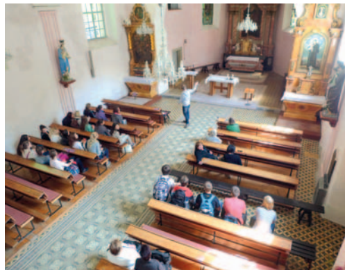
Na Den kostelů zavítalo na komentované prohlídky Kostelíčka v průběhu dvou dní 300 návštěvníků.