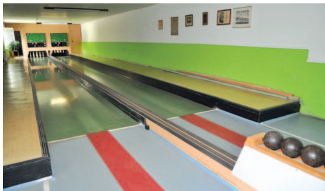
Takto vypadá prostor kuželny dnes.