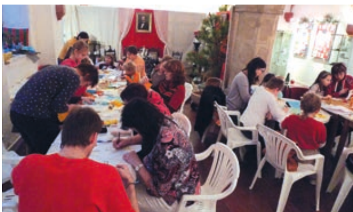
Každou adventní neděli se konaly na Vánoční výstavě výtvarné dílny.