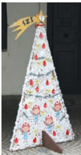
Střední zdravotnická škola Hranice