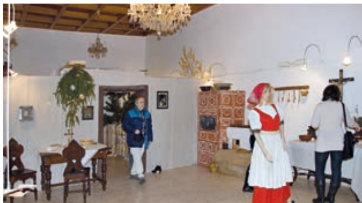
Vánoční výstava na Staré radnici přináší spoustu zajímavostí, sbírku vánočních pohlednic i obrazy zimních Hranic. K vidění je až do 10. ledna.