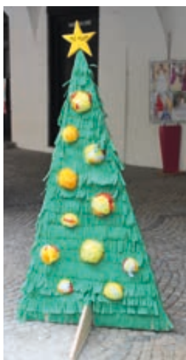
MŠ Míček Hranice