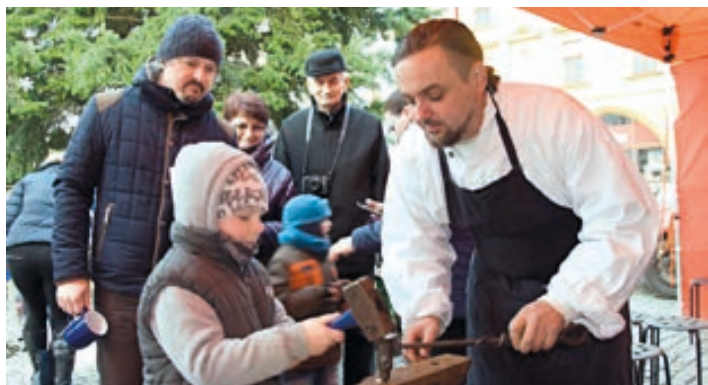
V průběhu prosince si mohli děti i dospělí vyzkoušet různá stará řemesla jako řezbářství, tiskařství, hrnčířství, svíčkařství, kovařinu, ale také sledovat výrobu mincí či pražení kávy na historické pražičce. Například první den si lidé odnesli tisíc pohlednic se starou dřevořezbou, které si mohli sami vyrobit.