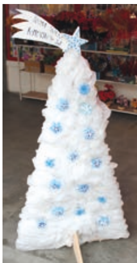
Prima školka Hranice