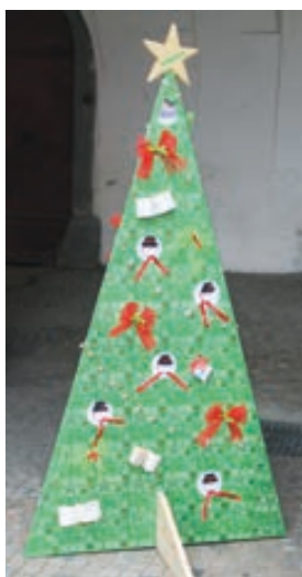
Městská knihovna Hranice