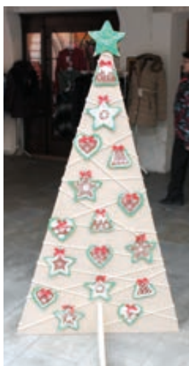
Školní družina Šromotovo Hranice