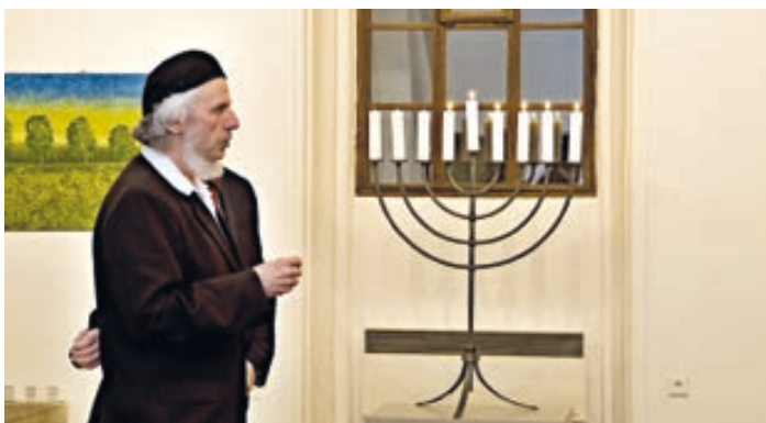
Zájem veřejnosti vzbudil i program „Židovské Vánoce“, který se uskutečnil v hranické Synagoze. Nechyběly židovské anekdoty, výtvarná dílna pro děti, ani ochutnávka tradičních chanukových pokrmů.