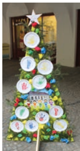
Jesličky Pianko Hranice

„Je to nádherná práce. Nedokážu ani říct, který se mi líbí nejvíc, protože každý je unikátní a krásný. Oceňuji hlavně jedinečné ná-