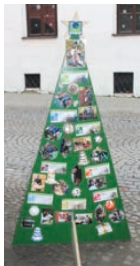
Střední průmyslová škola Hranice