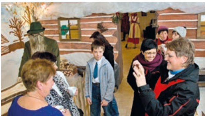
Vánoční zvyky, i ty zapomenuté, připomíná Vánoční výstava na Staré radnici v Hranicích. Návštěvníky s nimi seznámí průvodce a zájemcům je předvede včetně působivého lití olova.