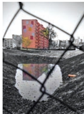
Úpravy se letos dočkaly i hranické rybníky.

Jednou z velkých akcí druhé poloviny roku 2015 byla 3. etapa rekonstrukce sídlíště Galašova. Akce stojí 13,7 milionů korun a město na ni získalo dotaci z programu regenerace panelových sídlíšť Ministerstva pro místní rozvoj. Tato etapa se týkala zejména severní části sídlíště a přilehlého svahu, kde se předělávaly komunikace, zejména chodní-