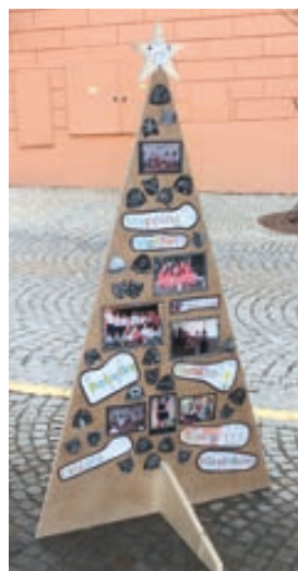
Stepařská škola Stepping Mothers