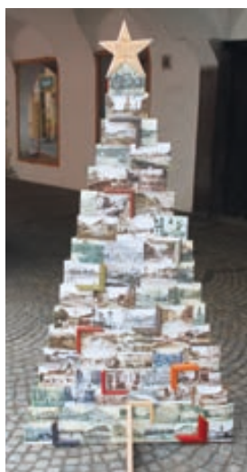
Městské muzeum a galerie Hranice