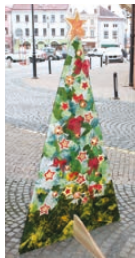
ZŠ 1. máje Hranice