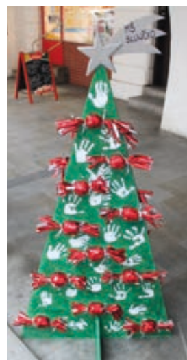
MŠ Sluníčko Hranice