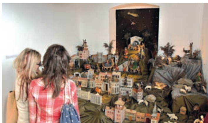
Unikátní, dvě stě let starý betlém, který tvoří 78 postav a 38 staveb. Návštěvníci si mohou zazvonit na zvoníčku betlému.