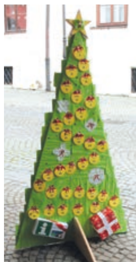
Turistické informační centrum Hranice