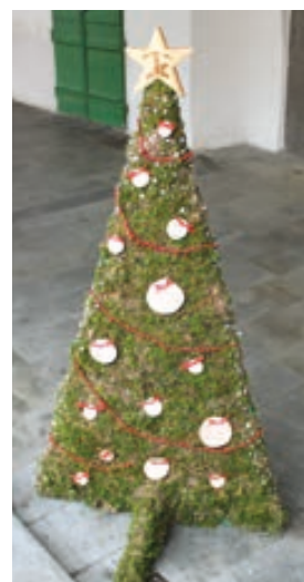
Střední lesnická škola Hranice