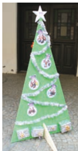
Soukromá střední odborná škola Hranice