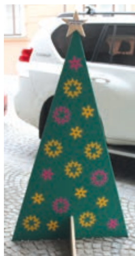
ZŠ a MŠ Hranice Nová