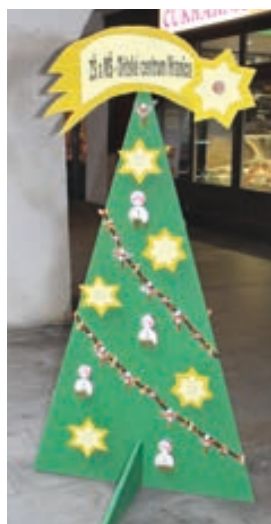
ZŠ a MŠ Dětské centrum Hranice