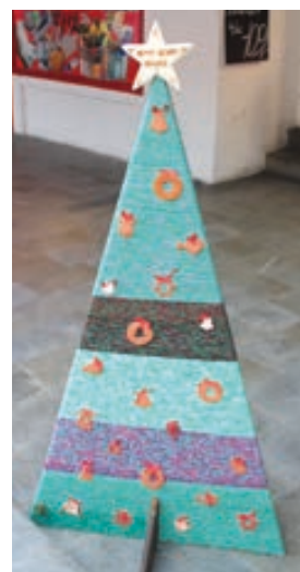
Domov seniorů Hranice