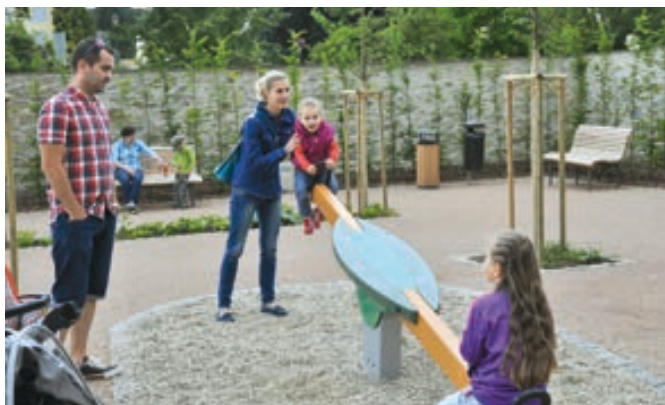
Dětské prvky v Zámecké zahradě lákají a baví.

Zpevněná vydlážděná plocha v rovině terénu a navazující dřevěné lavice na pobytových terasách dnešního svahu pod hradbami umožňují pořádat menší kulturní vystoupení. Celá rekonstrukce prostoru pod zámek stála 18 milionů korun. Město na ni získalo dotaci z Regionálního operačního programu Střední Morava.