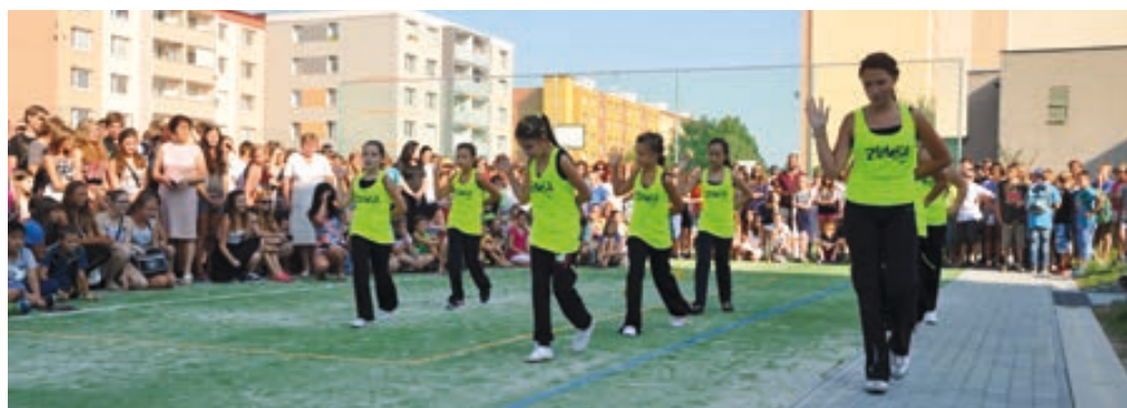
Slavnostní otevření multifunkčního hřiště na ZŠ 1. máje.

Dům s pečovatelskou službou dostal teplejší „kabát“. Proběhlo zde zateplení fasády, výměna oken a dveří a dozateplení střešního pláště. Akce měla za cíl zvýšit energetickou efektivnost budovy, která byla stavěná v 90. letech minulého století a vyšla na 5 milionů ko-