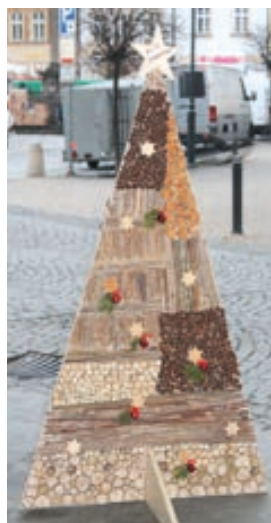
ZŠ a MŠ Struhlovsko