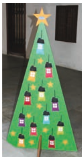
Dům dětí a mládeže Hranice