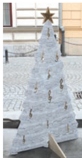
ZUŠ Hranice - hudební obor