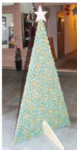
MŠ Pohádka Hranice