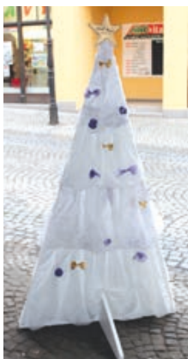
ZUŠ Hranice - taneční obor