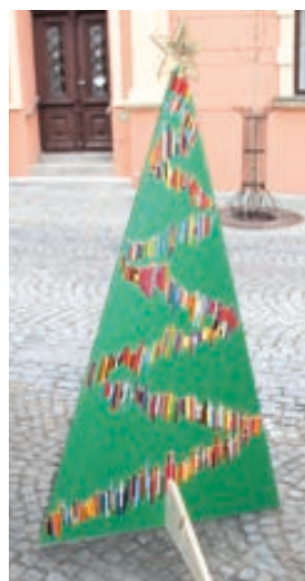
ZUŠ Hranice - výtvarný obor