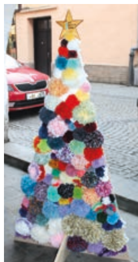
MŠ Šromotova pastelka