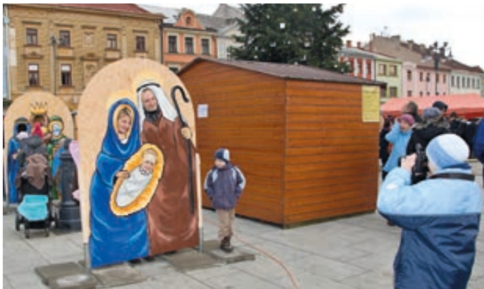
Pro navození vánoční atmosféry posloužily i panely se čtyřmi vánočními motivy, kde se lidé mohli fotit. Výtvarné panely vytvořili žáci ZUŠ Hranice pod vedením pedagogů Tomáše Janíka a Evy Vojtěškové.