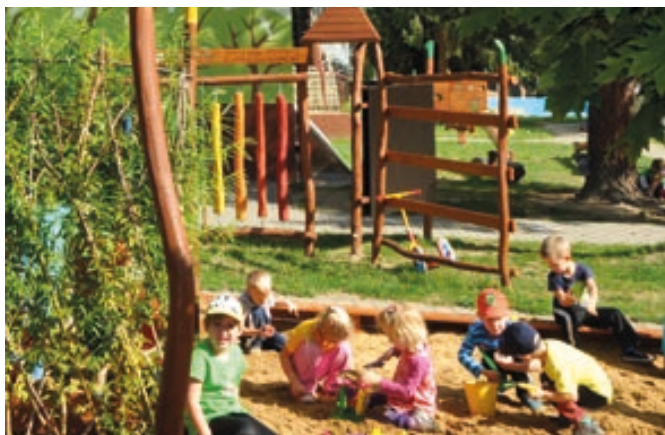
Netradiční hřiště v přírodním stylu s jurtou vzniklo u mateřské školy na Struhlovsku.

Nové netradiční hřiště v přírodním stylu s domorodou vesnicí, jurtou a různými přírodními atrakcemi vzniklo u ZŠ a MŠ Struhlovsko. Na tento projekt získalo město dotaci z Evropského fondu pro regionální rozvoj v rámci Operačního programu Životní prostředí. Stavba stála necelé 4 miliony korun. Hřiště