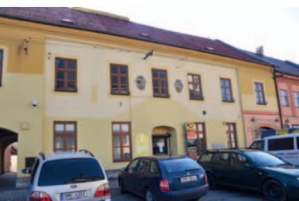
Budovu v Drahotuších pronajme město Hranice měsíčně za 19 470 korun bez DPH.