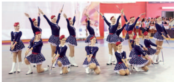
Na mistrovství světa mažoretek v Praze si připomněli počátky mažoretkového hnutí v Hranicích.