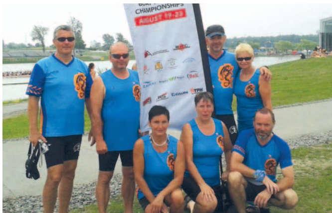
Členové KVS Hranice, kteří uspěli v Kanadě.

Češi závodili ve veteránských kategoriích. Českou dvacetimístnou dračí loď obsadily ženy