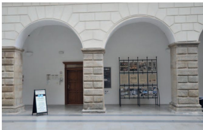
Služeb Czech POINTu lze využít na podatelně a informacích městského úřadu na zámku.

Ten, kdo chce mít jistotu, že nebude dlouho čekat, se může objednat i přes internet. Od roku 2010 funguje elektronický rezervační systém na řadu agend městského úřadu, přesněji na agendy dopravně - správní a agendy týkající se občanských průkazů, cestovních pasů a změn pobytu. Posléze se rezervační systém rozšířil o matriku a ově-