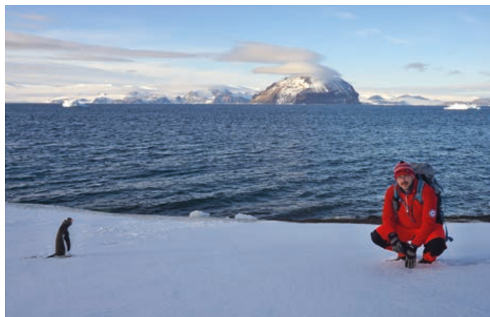
I v tak pusté krajině člověk občas narazí na „spřízněnou duši“.

Tam je hlavní problém s tekoucí pitnou vodou. V tom jsme byli dost závislí na počasí a mrazu. Obecně je tam vody dost. Ale buď je slaná, a ta nejde použít prakticky na nic, protože její korozivní účinky jsou enormní a i odpad by rychle vzal za své, kdyby se používala třeba na splachování. Nebo je tam voda sladká, ale ta je většinou zmrzlá. Studny tam hloubit nelze, je tam permafrost, čili věčně promrzlá půda, kdy toto promrznutí sahá několik set metrů hluboko. Ale v létě, když se tam přeci jen trochu oteplí, tak