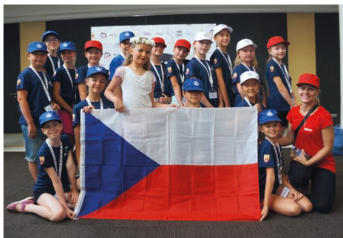
Žáci tanečního oboru ZUŠ Hranice.

Náš první soutěžní den, tedy pondělí 25. června, začal registrací tanečníků přímo v místě konání soutěže. Za přísných bezpečnostních pravidel jsme se dozvěděli, kde máme šatnu a mohli si prohlédnout prostory