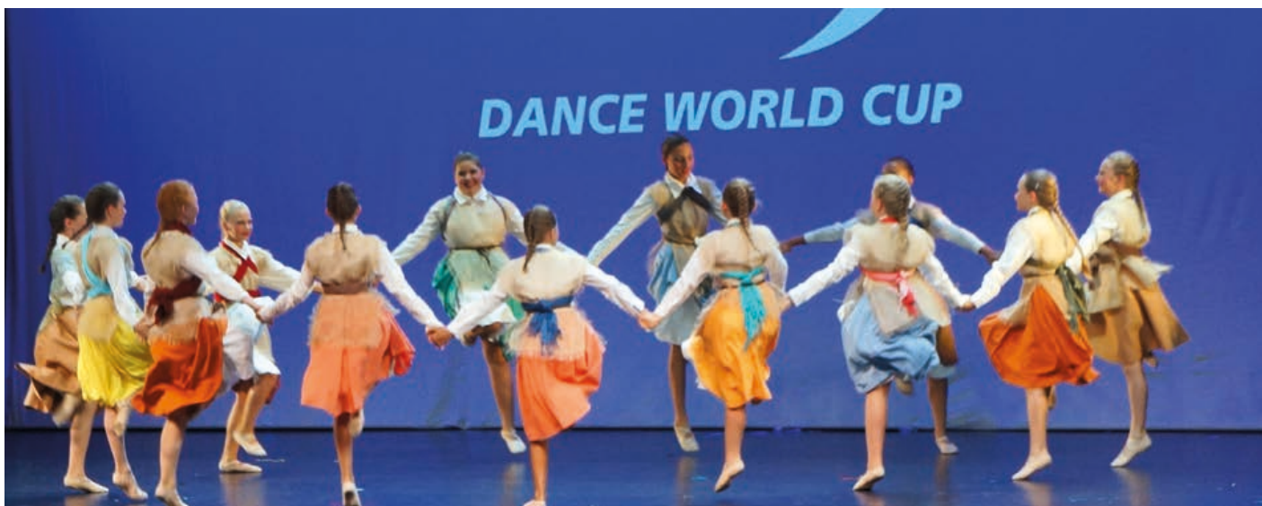
S choreografií „Masopust“ si dívky z Hranic vytančily 11. místo, a to v kategorii Národní a lidový tanec – skupiny.