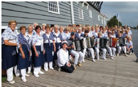
Na hranickém náměstí vystoupí v neděli 28. října odpoledne holandský sbor De Vietgrieten.

Připraveny jsou také ukázky vystoupení sletových sokolských cvičení v režii hranických Sokolů. Nebude chybět ani občerstvení v prvorepublikovém duchu. Akce se koná u příležitosti oslav 100 let od vzniku samostatného československého státu. Program začíná ve 14 hodin v neděli 28. října na hranickém Masarykově náměstí. Více informací na kultura-hranice.cz a na plakátech. (red)