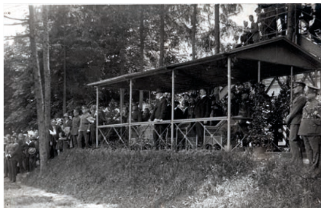
Prezident Masaryk sleduje dění v parku za přítomnosti důstojníků a občanů.