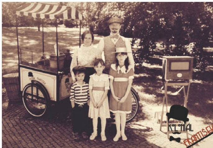
Ve dvoraně zámku navodí prvorepublikovou atmosféru flašinetářka a prodávající cukrové vaty.

Kdo bude mít zájem, může si nechat nakreslit vlastní kari-