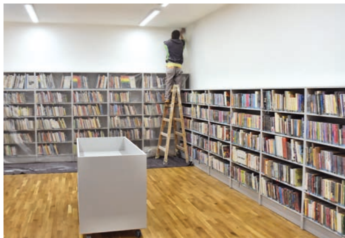
V knihovně běží na plné obrátky přípravy na její otevření.

Připomínáme, že knihovna bude opět otevřena každou sobotu od 9 do 12 hodin. Návštěvníci uvidí na stropě jedné místnosti odhalené původní malby. Ty byly v průběhu rekonstrukce zakonzervované a v budoucnu je čeká restaurování, což vyžaduje důkladnou přípravu a také finanční prostředky, proto nebylo možné provést restaurování v průběhu rekonstrukce. Návštěvníci