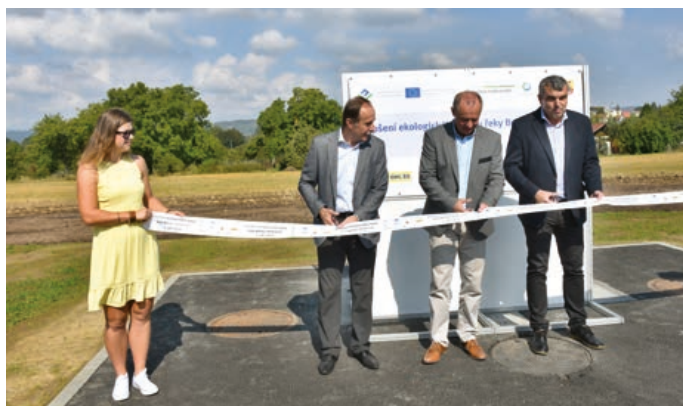
Slavnostní ukončení stavby největší z retenčních nádrží. Ta ovšem není vidět, je skryta pod povrchem.

Účelem retenčních nádrží s celkovým objemem cca 3 000 m 3 je zachytit při deštích silně znečištěnou vodu z jednotlivé kanalizace, která by jinak otekla do řeky a po odeznění dešťů zachycenou vodu přecherpat a vyčistit v ČOV. Nová splašková kanalizace má délku přes tři kilometry a její součástí jsou dvě čerpací stanice.