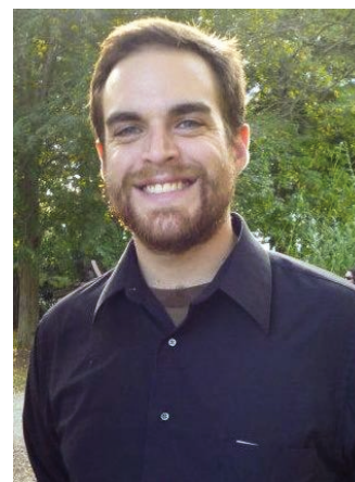
Americký tenorista Benjamin Berman.

18:00 - okénko prvorepublikové etikety, seznámení s pravidly, která zavedl Guth-Jarkovský. Následovat budou ukázky prvorepublikových tanců.