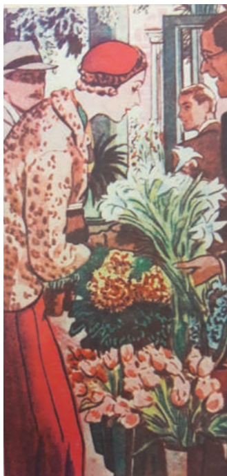
Výstava nabídne i ukázky prvorepublikové módy.

Do časů první republiky návštěvníky přenese výstava na Staré radnici. Těšit se mohou na dobový nábytek, techniku, oblečení a historické fotografie Hranic.