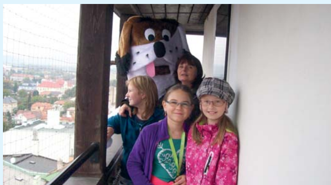
Maxipes Fík si začátkem října povídal na věži Staré radnice s malými čtenáři, které obdaroval sladkostmi. Akce se konala v rámci Týdne knihoven.