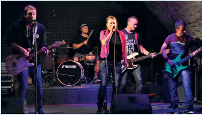
Skupina Neřeš koncertovala v Zámeckém klubu v pátek 16. října.