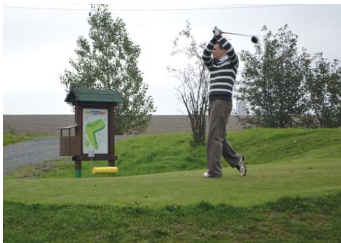
Devítijamkové hřiště v Radíkově nabízí hru pro všechny věkové kategorie. Bonusem jsou nádherné výhledy do okolní přírody.