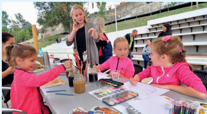
Trávník v Zámecké zahradě zaplnily deky. V sobotu 3. října se tam totiž konal piknik při příležitosti výstavy na stromech, která se jmenovala Plné ruce práce. Zavítaly na ni zhruba dvě stovky lidí.