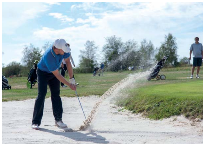
Na mistrovství klubu se golfisté museli vypořádat i s odpalem z bunkeru, což je písková překážka.