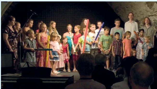
V říjnu se v Zámeckém klubu uskutečnilo pět koncertů, promítalo se pásmo filmů o extrémních zimních sportech a konaly se i besedy a další akce.