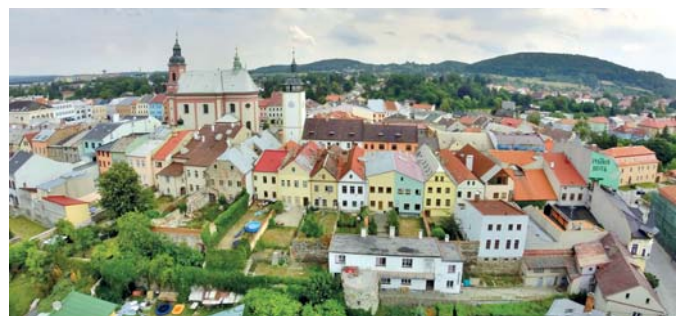
Hranické náměstí ve směru od Motošína.