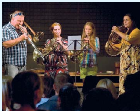
Zámecký klub zaplňovali i v říjnu diváci na koncertech.