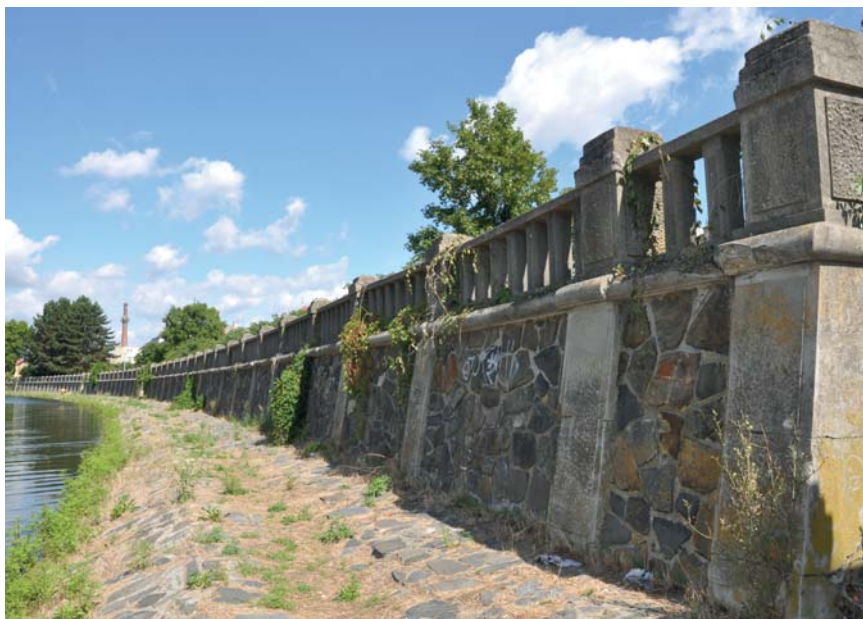
Nábřeží v Kropáčově ulici.

Cílem studie je propojit prostor nábřeží s přilehlým pásem zeleně a Kropáčovou