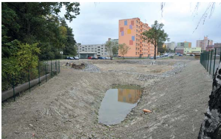
Pro obojživelníky a další živočichy byla zřízena hlubší tůňka. V pozadí je rybníček Nováček.

Soustavu nádrží tvoří dva Horní rybníčky, rybník Kuchyňka a menší rybníčky v okolí - Skřídlák, Nováček a chovné rybníčky-bazénky. Všechny nádrže byly značně zabahněné a jejich břehy i hráze nestabilní. Také přírodní potrubí od potoka Ludina bylo