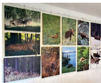
Velkoformátové fotografie Jaroslavy Pešaté v galerii M+M Hranice.