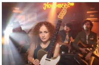
November 2nd.

Režii záznamu, který na jaře odvysílá Česká televize, bude mít na starosti Richard Řeřicha. S kapelou spolupracoval na jejich úspěšných klipech Run nebo I Feel Love a stojí také za celove-