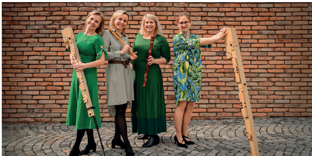
Londýnské flétnové kvarteto iFlautisti.