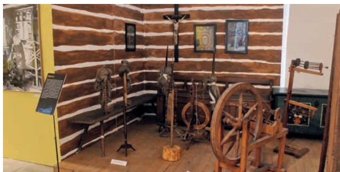
Výstava Za zimních večerů v chalupách je k vidění v muzeu na Staré radnici až do 2. února 2025.

Touto výstavou ze sbírek Vlastivědného muzea v Šumperku navštívíte dobu, kdy na vesnicích končily zemědělské práce a chlad a nedostatek světla zahnal lidi do světnic, kde vykonávali drobné práce jako tkání, vyšívání, výrobu košíků, pometel či šindelů. Dozvíte se, ale také si prakticky