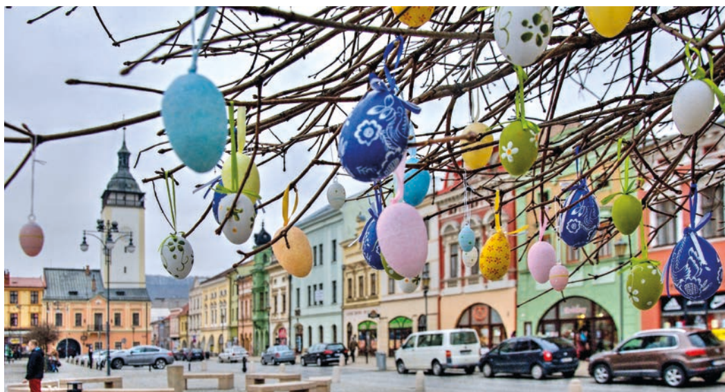
Kraslicovník zdobí hranické náměstí díky pomoci Hraničanů, kteří vytvářejí na netradiční strom nádherné a originální kraslice.

Lidé mohou vyzdobená velikonoční vajíčka nosit opět do