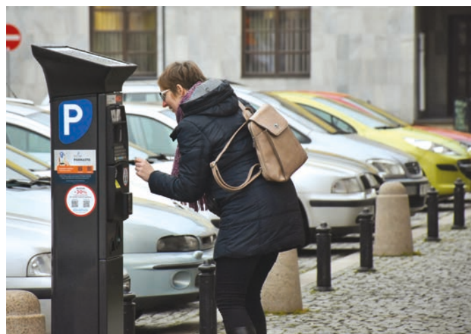
Hranice mají nové moderní parkomaty.

Vincker Michal, Ekoltes, Vedoucí provozu 6