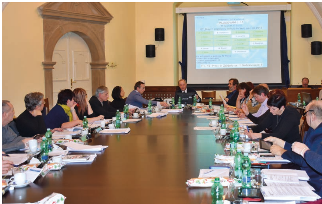
Zastupitelé v prosinci schválili rozpočet města.

s více než 7 miliony korun. Město zejména přispívá na Domov seniorů zhruba 5 miliony korun, podporuje ale i řadu dalších aktivit. Necelým půl milionem například Klub seniorů, přiděluje granty a příspěvky ve výši přes půl milionu korun, podporuje organizace jako Elim či Charitu.