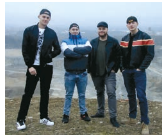
Kapela Inhibitor.

Na své si přijdou i příznivci trash metalu a metalcoru. V průběhu večera vystoupí kromě kapely Inhibitor také kapela B.B.R. z Nového Jičína a Secrets of Separation z Valašského Meziříčí.