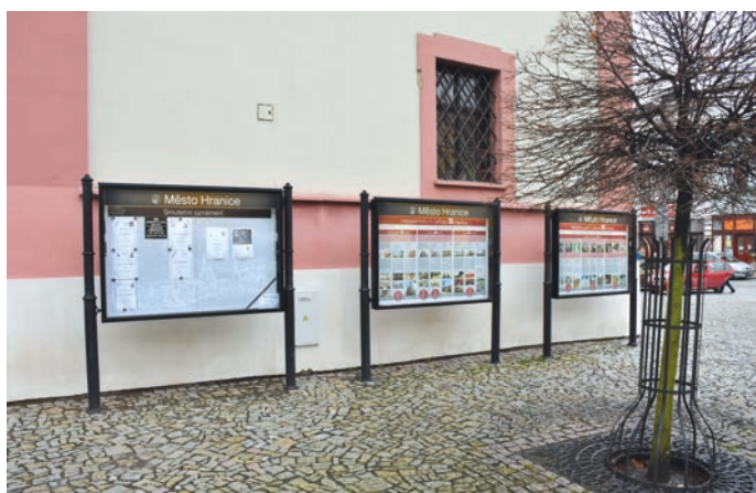
Nová společná vývěska pro smuteční oznámení u kostela.

Společná vývěska, na které můžete nalézt parte obou hranických pohřebních služeb, se nyní nachází na Masarykově náměstí v Hranicích u kostela Stětí sv. Jana Křtitele. Lidé tak už nemusejí přecházet z jedné strany náměstí na druhou od samostatných vývěsek jednotlivých pohřebních služeb, ale mohou si na jednom místě přečíst smuteční oznámení. Město Hranice vytvořením této společné vývěsky reagovalo na požadavky občanů. Jak bude ale společná vývěska fungovat, závisí na obou pohřebních službách, protože ty si do ní budou parte vyvěšovat samy. (bak)