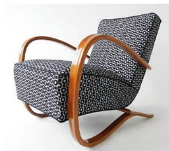
Křeslo Halabala - Kalendář 2018 První republika - Fortuna Libri, spol. s.r.o.(2)