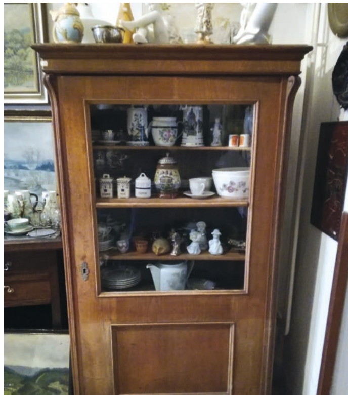
Městské muzeum v Hranicích uvítá zapůjčení nábytku z období první republiky.

Věci je možné darovat kdykoliv, a to i k jiným oblastem, na které se muzeum ve svých sbírkách orientuje, což je převážně regionální tematika ve všech sfé-