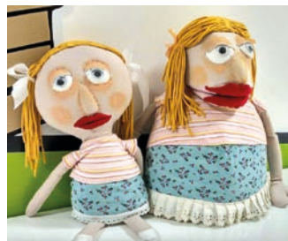
Pohádka Ježek a sněhulák se uskuteční v neděli 25. února.

a sněhulák, která je o dobrodružném kamarádství mezi zatoulaným ježkem a kamarádkým sněhulákem. Děti tak poznají, že rozdíl v tělesné stavbě a příslušnosti k druhu nehrá v dobrém kamarádství roli. Opravdoví kamarádi se tolerují i se svými nedostatky.