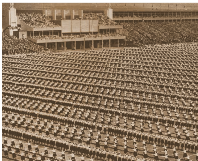
Ženy v hromadném vystoupení o X. sletě všesokolském na Strahově r. 1938.

Rozhodující byl sjezd na pražském výstavišti konaný 7. ledna 1990, kam přišlo téměř 3000 lidí. Rychle se obnovovaly sokolské jednoty, kterých je dnes již zhruba 1200. Obnovené jednoty však jen těžko získávaly zpět svůj bývalý majetek. Organizačně byla obnovena také většina žup v Čechách a na Moravě, násled-