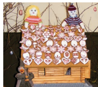
Na výstavě nebude chybět perníková chaloupka.

ství kraslic různých velikostí, barev a zdobené různými technikami, ale také další výrobky spojené s tímto svátkem. Lidé si tak mohou prohlédnout výtvary z šustí, dřeva, papíru i keramiky, perníčky, pomlázky, vizovické pečivo či věnce. Svou tvorbu prezentují v soukromé galerii především jednotlivci z Hranic i okolí, vystavená díla zapůjčují také školy, školky a různé organizace. (rk)