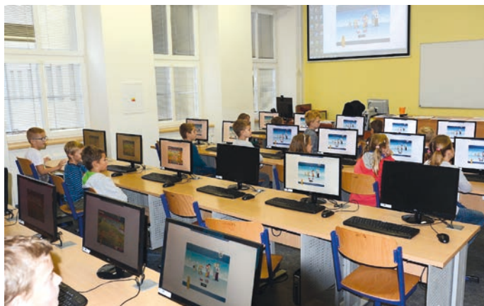
Moderní počítačová učebna ZŠ Drahotuše.

formatika, příprava na přijímací zkoušky na SŠ