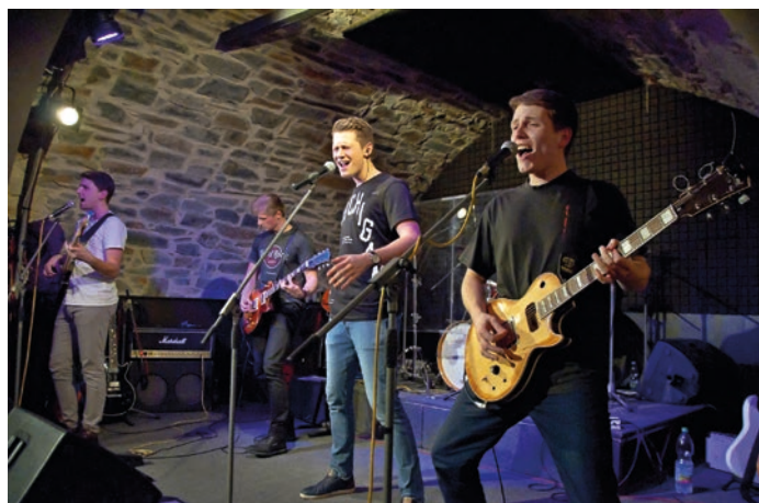
Kapely Backlight (na snímku) a skupina Hranice vyprodaly v pátek 3. února Zámecký klub. Začínající Backlight zahráli především ikonické rockové písně. Skupina Hranice, která na koncertu oznámila změnu svého dosavadního názvu Fénix na jméno připomínající jejich rodné město, pak publiku představila především vlastní skladby.