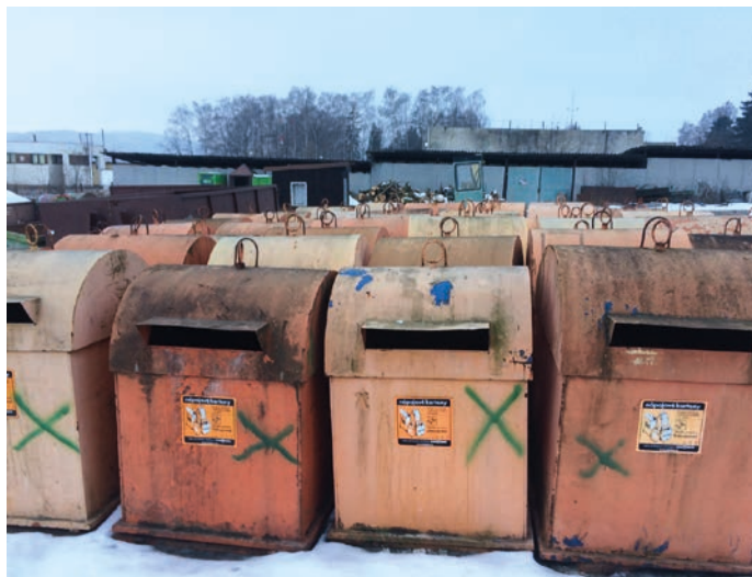
Oranžové kontejnery čekající na likvidaci.

Na celém území města Hranic je 126 kontejnerových hnízd. V minulém roce bylo vyměněno 42 žlutých kontejnerů za nové a o dalších 16 kusů byla sběrná síť rozšířena. Na pár místech tak místo oranžového kontejneru stojí nový žlutý. Třídění nápojových kartonů by nyní