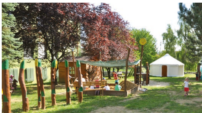
Nejen ve třídách, ale i pod širým nebem ZŠ Struhlovsko děti inspiruje.

aktivní tabule, tablety, experimentální digitální zařízení, meteorologickou stanici. • Budujeme nové prostoty pro pracovní činnosti. • Pro výuku jazyků máme digitální jazykovou laboratoř i vlastní počítačovou učebnu, cestujeme do zahraničí nejen v rámci projektu Erasmus +.