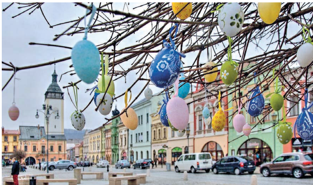
Kraslicovník sklídl v loňském roce nejen u obyvatel města velký úspěch.

Předvelikonoční atmosféra pak navodí také akce Vítání