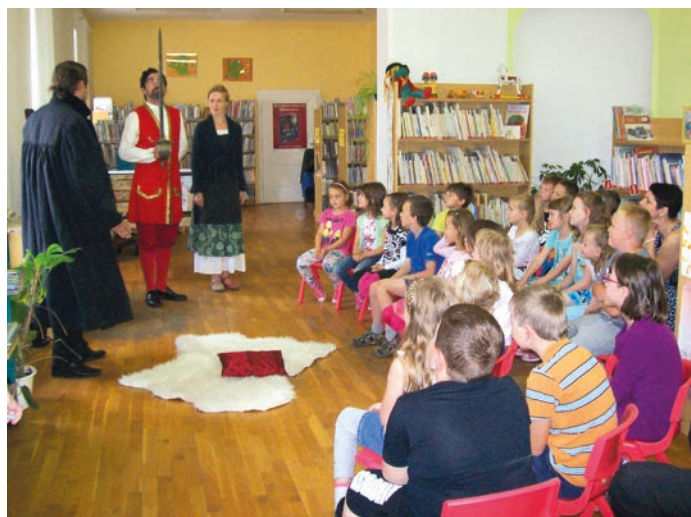
Také letos budou prvňáčci v knihovně pasováni na čtenáře.

Všichni prvňáčci hranických škol se pilně učí číst, aby v závěru tohoto školního roku mohli být v knihovně slavnostně pasováni na čtenáře.