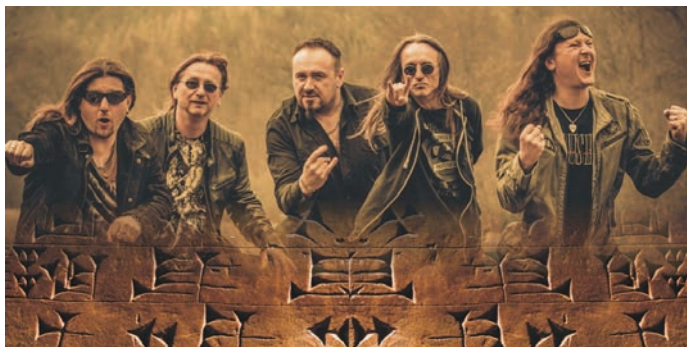
Hranický Traktor chystá vystoupení také na domácí půdě.

Na podiu také diváci uslyší a uvidí trojku The Pant, kteří je-