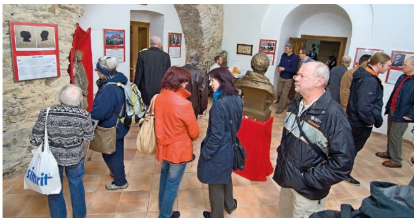
Nové muzeum na zámku se otevřelo výstavou k 260. výročí významné hranické osobnosti J. H. A. Gallaše.