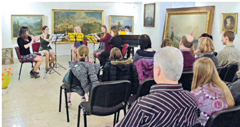
Hudba mezi obrazy – tak se jmenoval koncert absolventů a učitelů ZUŠ Hranice, který se odehrál 8. dubna ve výstavní síni na Staré radnici.