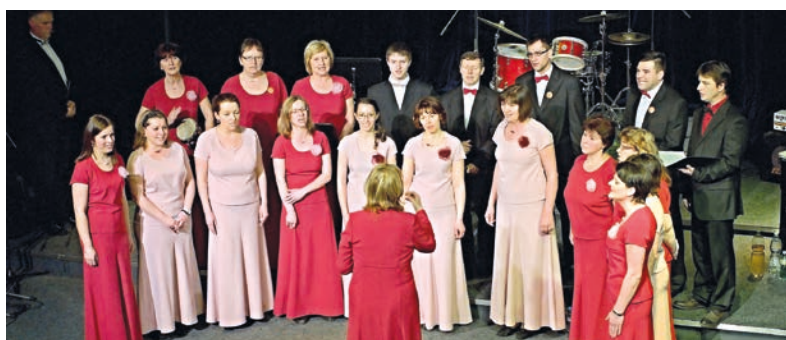
Smíšený pěvecký sbor Harmonia oslavil třicet let od svého založení hudebním setkáním 16. dubna v Divadle Stará střelnice.