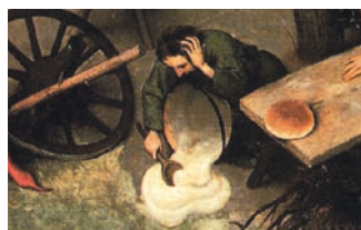
Jedno z přísloví na Bruegelově obraze říká Plakat nad rozlitym mlékem.

Více členů rodiny věnující se výtvarnému řemeslu není v uměleckém světě nic neobvyklého, ať už se podíváme do období renesance, baroka či 19. století, do Itálie, Nizozemí nebo českých zemí. A to je právě téma, kterému se budou věnovat tři květnová povídání. Začínat budou v 17 hodin v muzeu na Staré radnici a vstup bude zdarma.