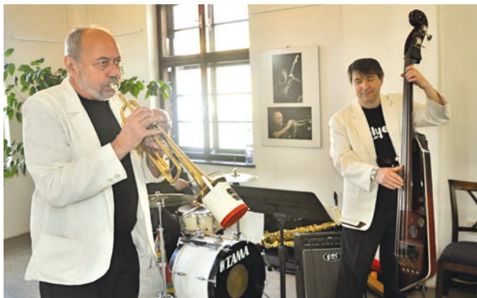
V Galerii severní křídlo zámku odstartovala 13. dubna vernisáž výstava fotografií z loňského ročníku Evropských jazzových dnů.