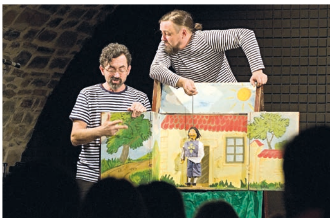
Dětem patřil Zámecký klub 10. dubna, kdy se pro ně konalo loutkové představení a po jeho skončení pak výtvarná dílna.