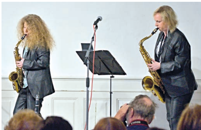
Trio Esprit vystoupilo v rámci Evropských jazzových dnů 5. dubna v Koncertním sále a pro diváky si připravilo pořad věnovaný známé šansoniérce Edith Piaf.