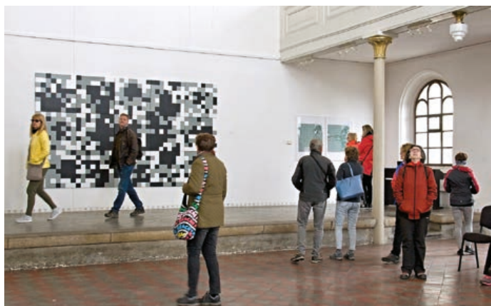
Výstava Viktora Hulíka má zvláštní kouzlo.

V pátek 26. dubna byla vernisáž zahájena výstavou slovenského malíře a galeristy Viktora Hulíka. Jeho asambláže, koláže, prostorové kresby a různé objekty obsahují většinou základní