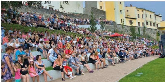
Zámecká zahrada bude opět v červenci a v srpnu patřit festivalu Hranické kulturní léto.

hradě, začíná se vždy v 18 hodin a vstup je zdarma. V případě nepříznivého počasí se akce konají v Zámeckém klubu. V tabulce níže přinášíme přehled akcí letošního ročníku, podrobnosti najdete na www.kultura-hranice.cz .