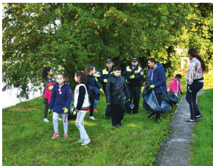
Asistenti prevence kriminality organizují například úklid města romskými dětmi.

Asistent prevence kriminality není strážníkem ani čekatelem, ale plní úkoly, které nejsou dle zákona o obecní policii svěřeny výhradně strážníkům nebo čekatelům. Při své činnosti jsou asistenti podřízeni konkrétnímu strážníkovi (mentorovi), který komplexně garantuje jeho činnost od vedení, podpory až po vystrojení. (bak)