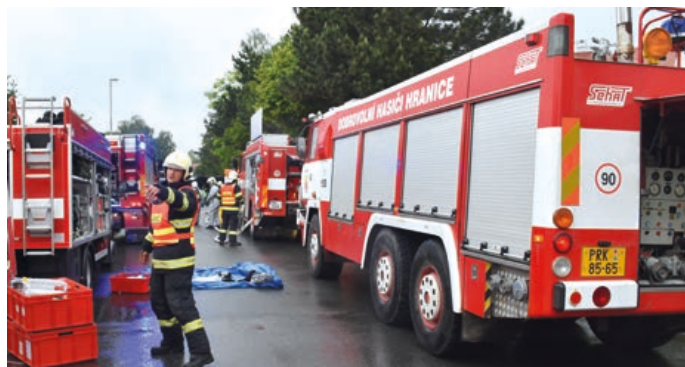
Profesionálové i hraniční dobrovolní hasiči spolu trénují i vážné zásahy. Tento snímek je z loňského nácviku likvidace převrácené cisterny s nebezpečnou látkou.

Šíře zásahů je takřka totožná s profesionály, od požárů přes technické zásahy až po dopravní nehody, a to v celé oblasti obce s rozšířenou působností Hranice. I proto mají vybavení prakticky totožné s profesionálními hasiči. Od června letošního roku jejich vybavení vylepší i nová cisternová automobilová stříkačka Scania. Dosud se museli spokojit se zastaralou cisternovou automobilovou stříkačkou Tatra z roku 1989. Projekt „Hranice - Cisternová automobilní stříkačka“ je spolufinancován z Olomouckého