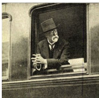
Odjezd prezidenta z hranického nádraží.

Poté se přesunul do vojenské akademie. Před ní čekal opět dav lidí. Nad průvodem prováděla leteckou show eskadra letců