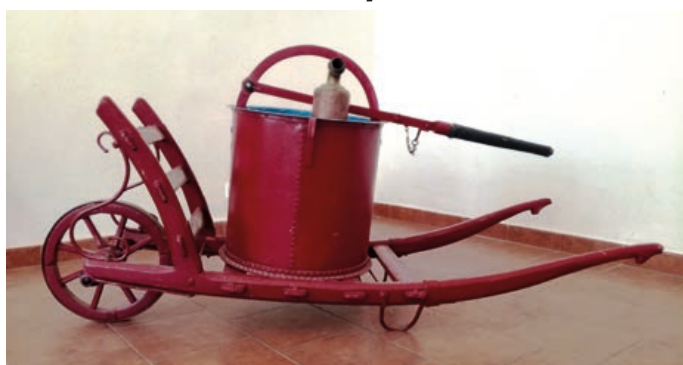
Ruční trakařová stříkačka.