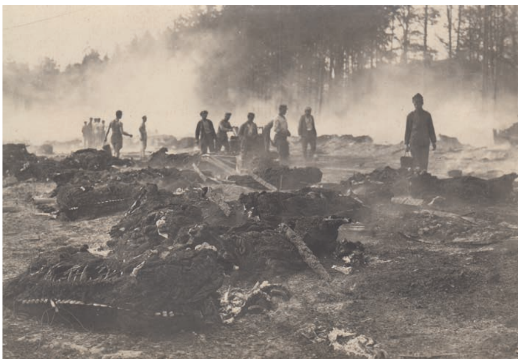
Při požáru ve vojenské akademii 12. srpna 1921 uhořelo 93 koní a škoda činila 4 miliony korun.

blízko něho byl nesnesitelný. Hasič Hubka měl popálené obě ruce.