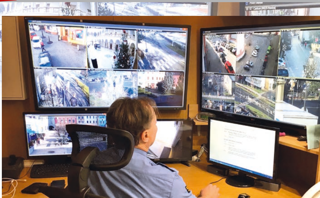
Kamerový systém nyní nabízí opravdu kvalitní obraz. Sledování několika obrazovek najednou ale není úplně snadné.

Dnešní téma je věnované bezpečnosti města. Na jejím zabezpečení se podílí samozřejmě policie jak státní, tak i městská, ale například i hasiči. A nezanedbatelnou měrou i každý z nás, protože když nic jiného, tak téměř všichni jsme účastníci silničního provozu.