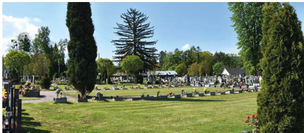
V tomto prostoru se chystá vybudování epitafních desek a posypové loučky.

Kanalizace povede od vstupu na hřbitov až k řece Ludině. Akce to nebude jednoduchá, protože v ulici vede velké množství inženýrských sítí, což může přinést značné komplikace. Na tuto část je v rozpočtu vyčleněno 12 milionů korun. Mimo budování kanalizace se také upraví zpevněné plochy v ulici Hřbitovní a po pravé straně bude upraveno devět parkovacích míst.