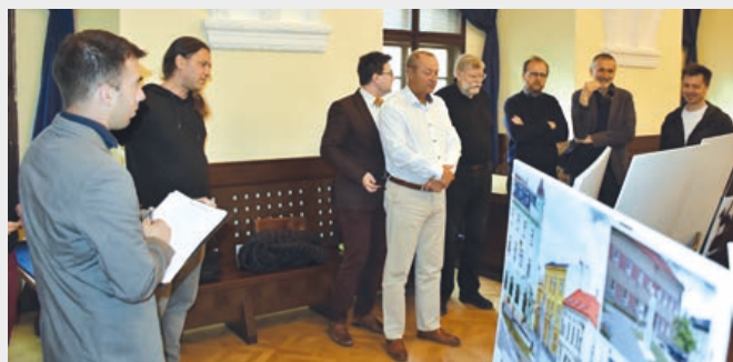
Odborná porota posuzuje předložené návrhy.

Jako nejvhodnější byl vybrán návrh jezdecké sochy Ladislava Sorokáče a Ondřeje Tučka, který vhodně reaguje na charakter daného prostoru a zároveň nechává prostor budoucím úpravám. Bronzová socha je umístěna uprostřed parkové úpravy náměstí a je orientována tak, aby byla jasně viditelná a zřetelná jak z Farní, tak i z Radniční ulice. Moderní pojetí sochy, zjednodušené na nezaměnitelnou plošnou siluetu státníka, je soudobou interpretací klasického jezdeckého pomníku. Dílo by mělo stát 3,5 milionu korun.