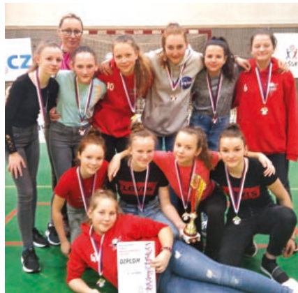
Mistryně republiky z Hranic.

Ve finále jsme opět narazily na favorizované hráčky z Mladé Boleslavi. Tyto hráčky vyhrávaly hravě svá utkání, včetně prvního zápasu s námi, a tak se předčasně