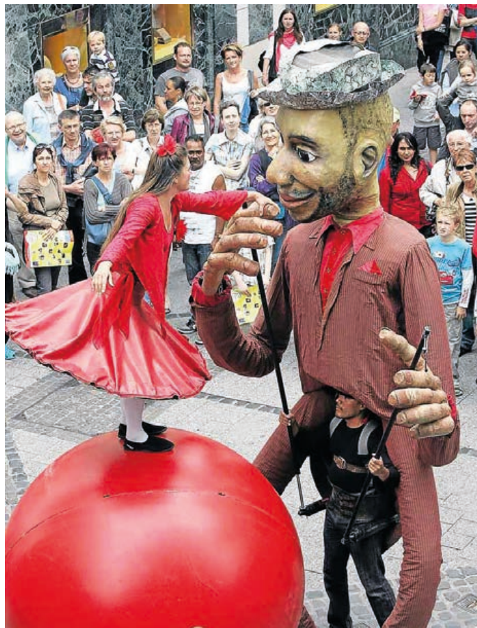
Top zážitkem v průvodu bude vystoupení „Compagnie with balls“, což obnáší taneční vystoupení na obřím balónu, se kterým si „pohrává“ velká loutka.

Zavítejte na oslavy 850 let Hranic a užijte si skvělý den. (nad)