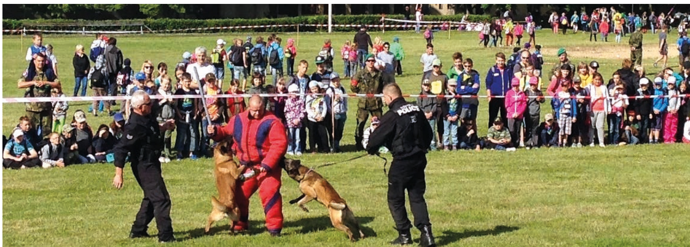
Hranické hry bez hranic – Bezpečné město. Městská policie předvádí činnost služebních psů.

Důležitou část práce Městské policie Hranice i Obvodního oddělení Policie ČR v Hranicích zahrnuje preventivní přednášková činnost na hranických školách.