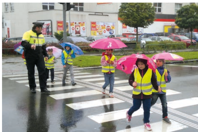
Strážníci městské policie pomáhají dětem na přechodech pro chodce.

Městská policie také dohlíží na dodržování obecně závazných vyhlášek města a nařízení mės-