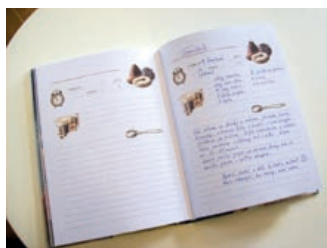
Hranická originální kuchařka se už plní rodinnými recepty obyvatel Hranic.

Zatím kuchařku nepůjčujeme domů, proto si doneste svůj recept napsaný s sebou a v knihov-