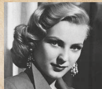
Miroslava Sternová.

Miroslava Sternová natočila v letech 1946 až 1955 celkem 30 filmů. Do zlatého fondu světové kinematografie patří její poslední filmy: Škola vandráků režiséra Rogella A. Gonzáleze (1954) a Zločinný život Archibalda de la Cruz (Pokus o zločin) Luise Buñuela (1955). Krátce po dokončení natáčení spáchala sebevraždu. V Mexiku o ní byl natočen celovečerní film, napsána divadelní hra i obsáhlá esej. (bak)