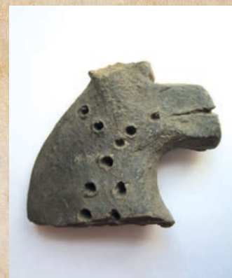
Keramická hlava koníka nalezená na hradě Svrčově.