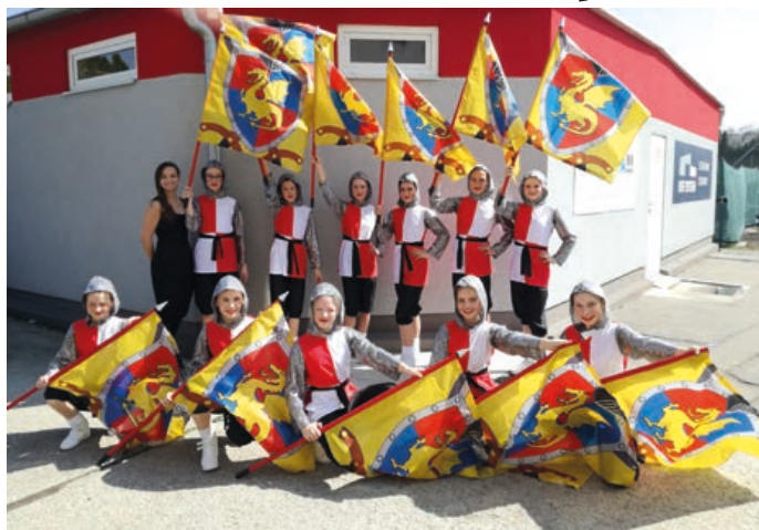
Vítězné družstvo v plné zbroji.

Těch nejstarších je dvanáct, nejvíc jich je ve střední kategorii, tam jich máme osmnáct