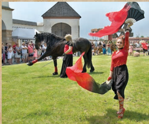
Na prostranství u zámku byla tři vystoupení fríských koní.