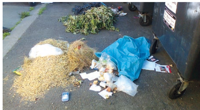
Město žádá občany, aby odpad neukládali mimo kontejnery.

Aktuální informace budou zveřejňovány na webových