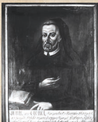
Mnich Jurik.

Benediktinský mnich Jurik je historická postava, kterou zmiňuje darovací listina z roku 1169, kterou olomoucký údělný kníže Fridrich (Bedřich) daroval území mezi řekou Bečvou a Odrou rajhradskému klášteru ke kolonizaci. Mnich Jurik se podílel na kolonizaci tohoto území, vedl mycení lesů, takže v poměrně krátké době vyrostla na táhlém ostrohu nad Bečvou osada, v roce 1201 již zvaná trhovou vsí. Datum úmrtí mnicha Jurika se uvádí v nekrologu rajhradského kláštera.