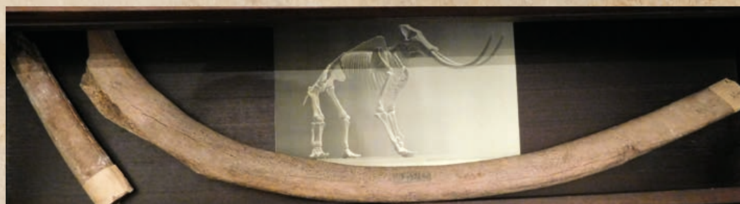
Mamutí žebro.

V pozdějším období mladší doby kamenné, které nazýváme neolit, vedla celou Moravskou bránou významná obchodní stezka. Směřovala od Jadrana po Balt a užívá se pro ni nejčastěji název Jantarová stezka. Osídlení z tohoto období bylo doloženo v areálu zříceniny hradu Svrčova.