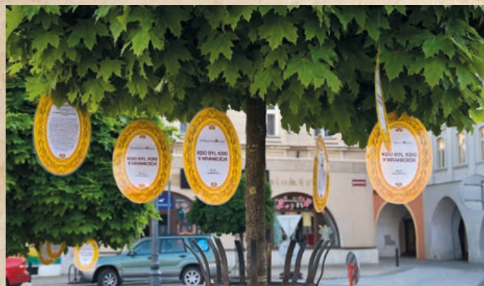
Oživením léta v Hranicích jsou medailony hranických osobností na stromech.

Projekt Knihovna v ulicích je malým historicko-vědným příspěvkem k oslavám 850 let vzniku města Hranice. Potrvá po celé léto až do konce září. Může tak