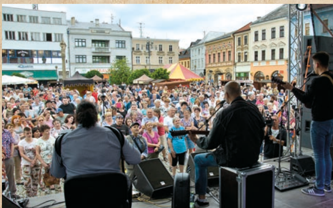
Na pódiu hrála skupina Plavci.