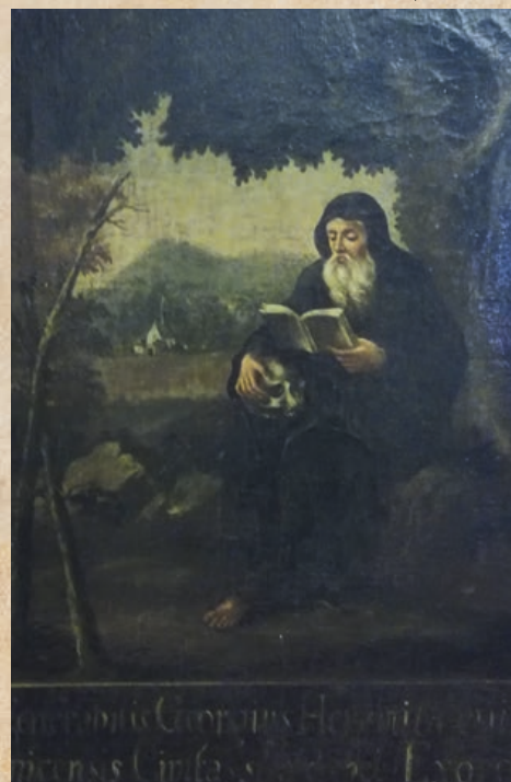
Postava mnicha Jurika se objevuje na spoustě obrazů.

Co ale s názvem Alba Ecclesia, neboli Weisskirchen? Existují hned dvě vysvětlení. První je, že