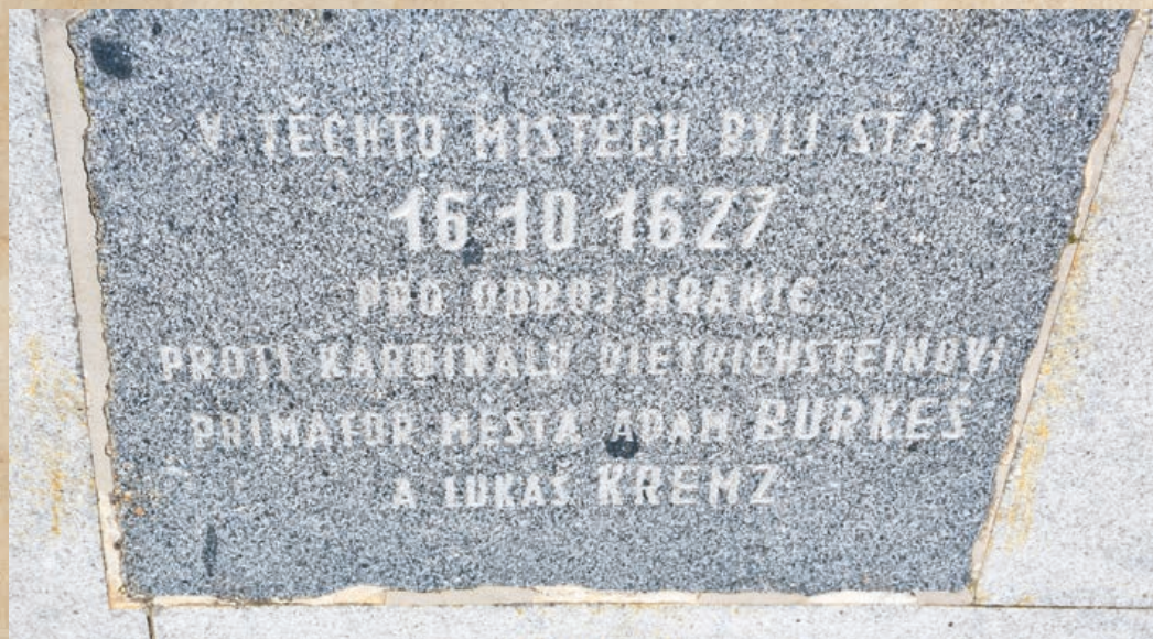
Místo poprav y dnes připomíná pamětní deska uprostřed Masarykova náměstí.

Mezitím stále trvaly vojenské hrozby, město se proto chystalo na případné obležení. Nepřítel se před hradbami objevil v listopadu 1623 a byla to uherská jízda. Uhři vypálili předměstí, pobrali, co se dalo, a zase odtáhli. Trvala ale také hrozba vzbouřených Valachů, proto proti nim povolal císař polské pomocné jednotky, které byly usídleny i v Hranicích. Okolí bylo vyjedeno, tak Poláci sháněli obživu, jak se dalo. Sám kardinál Dietrichštejn si na ně