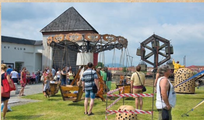
Na prostranství u zámku bylo pro děti historické ruské kolo, historický kolotoč a stan s nejrůznějšími hrami.