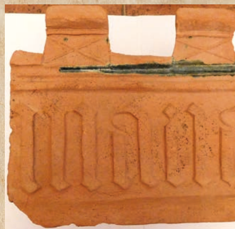
Římsový kachel z výzkumu na hranickém zámku.

Výzkumy na lokalitách v Hranicích a jejich okolí prokázaly osídlení v prostoru Moravské brány již v období paleolitu. Spousta materiálu však ještě