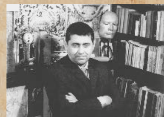
Jiří Brdečka.

Byl blízkým spolupracovníkem Jiřího Trnky, Jana Wericha a režiséra Oldřicha Lipského. Jeho nejslavnější dílo je parodie na westerny s názvem Limonádový Joe, která má řadu variant – povídkovou, divadelní, románovou, muzikálovou a filmovou. Je autorem scénářů k filmům Tajemství hradu v Karpatech, Adéla ještě nevečeřela. Jako scénárista se podílel i na filmech Byl jednou jeden král, Vynález zkázy, Až přijde kocour. Je autorem knih Kolty bez pozlátka, Faunovo velmi pozdní odpoledne a dalších povídek. Jiří