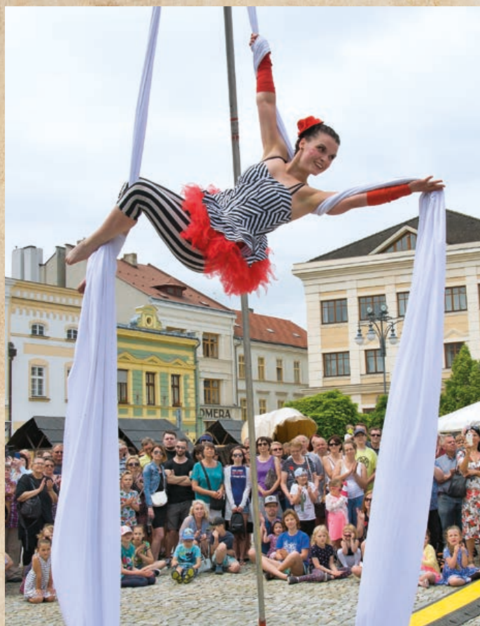
Diváky uchvátilo akrobatické vystoupení.