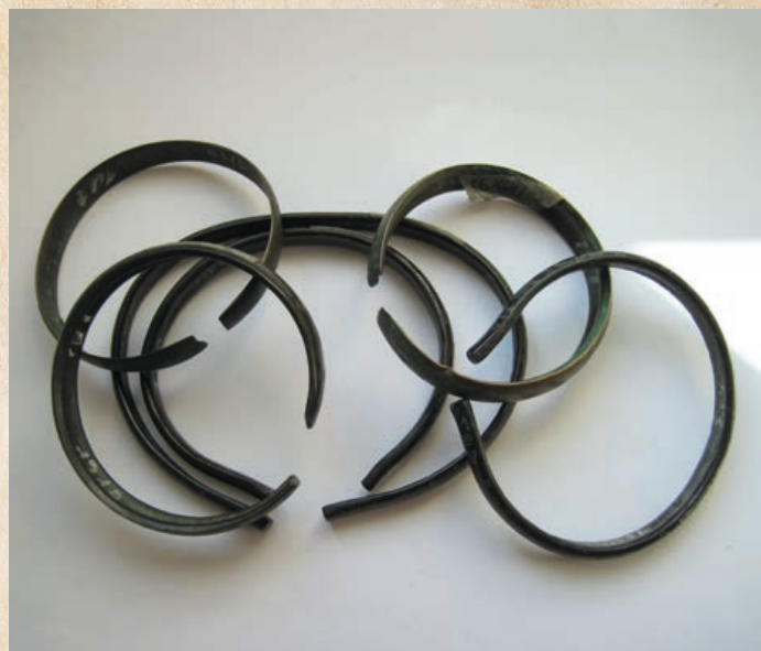
Bronzové náramky z takzvaného Černotínského pokladu z roku 1905.