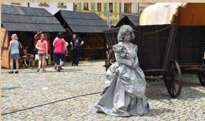
Mnohé překvapily živé sochy, se kterými se zájemci mohli vyfotit.