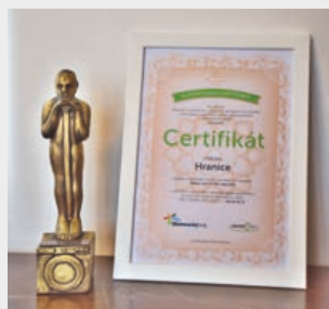
Město Hranice získalo Elektrooskara.

Nejlepšího výsledku v rámci Olomouckého kraje ve sběru vyřazených elektrozařízení v kategorii „Obec nad 10 000 obyvatel“ dosáhlo město Hranice. V roce 2018 nasbírali obyvatelé Hranic téměř 100 tun elektroodpadu (95,5 t). V porovnání s rokem 2017, kdy se nasbíralo 59,2 tun elektroodpadu, to je 61 procentní nárůst, největší v Olomouckém kraji.