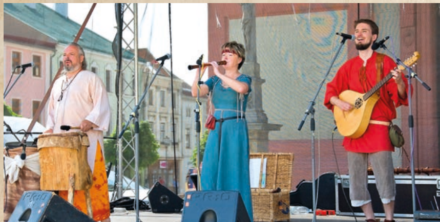
Na Masarykově náměstí zněla hudba různých žánrů, středověkem počínaje.