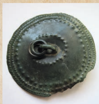
Štítová bronzová puklice z Černotínského bronzového pokladu z roku 1905.

K nejzajímavějším nálezům patří takzvaný Černotínský bronzový poklad z pozdní doby bronzové, který byl objeven při těžbě vápence v lomu na Vápenkách v roce 1905. Nejspíše se jednalo o pozůstatek ukrytého nebo ztraceného pokladu při cestě za obchodem. Součástí