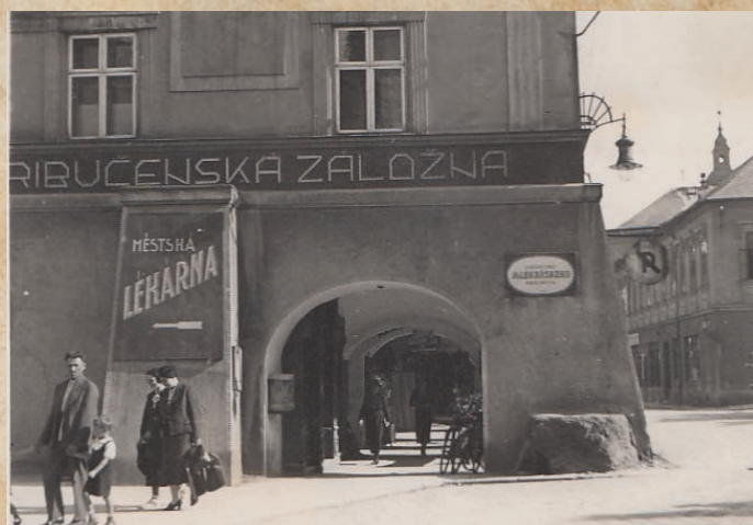
Pranířovací kámen na Pernštejnském, tehdy Kramářově náměstí v roce 1926.

...dle úředního záznamu došlo 27. 7. 1821 v Hranicích k zemětřesení ? Poškozena byla druhá zámekská věž (později zbořená) a došlo ke zřícení části hradeb od Horní brány až k baště u vrchnostenské kontribučenské sýpky v délce 20,5 sáhů. Jiné destrukce kronikář nezapsal.