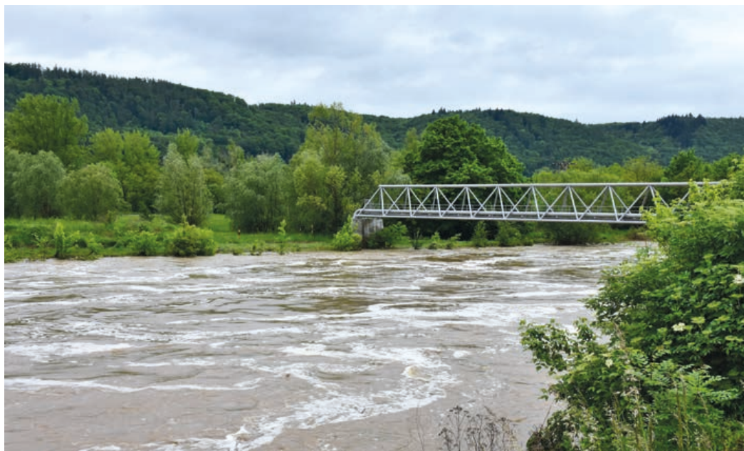
Pod jezem se místy Bečva vylila z břehů.